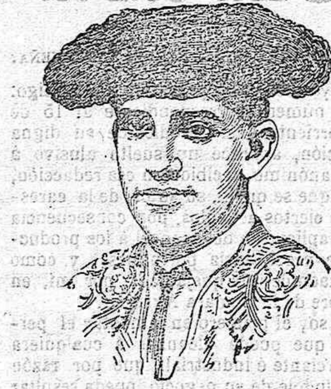
El famoso diestro Belmonte, que ayer jueves tomó la alternativa de matador de toros en la plaza de Madrid.

Se comprende una compañía del teatro Español con Ricardo Calvo—pongo por cumbre masculina—porque ya ese teatro