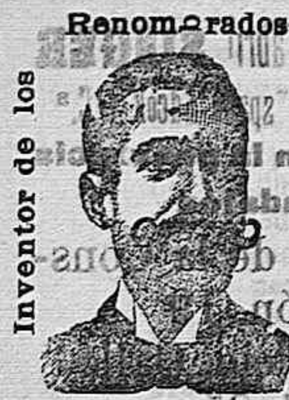
Inventor de los