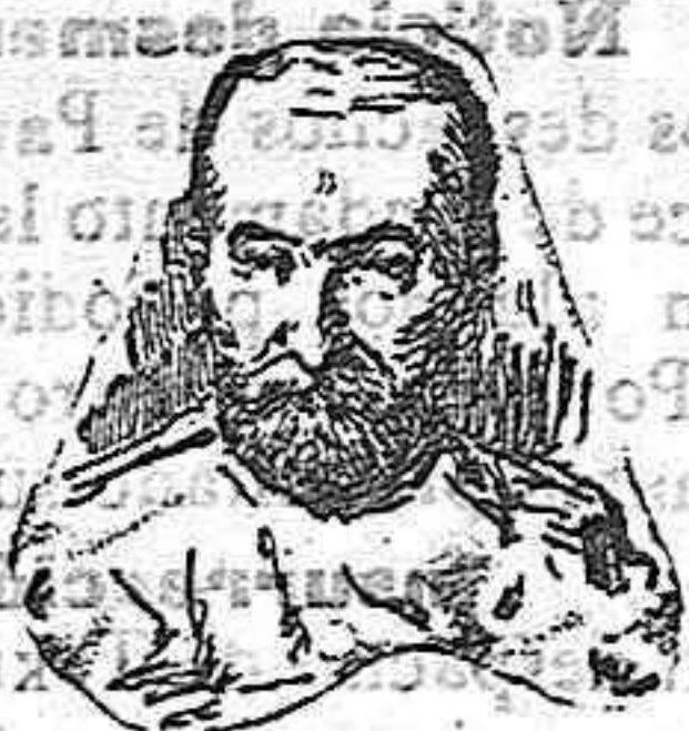
D. Alejandro San Martín.

Si el Sr. Moret ha querido que la cartera de Instrucción pública vaya á manos de un espíritu cultivado y moder- nísimo, bien elegida está para el caso la persona del Sr. D. Alejandro San Mar- tín.