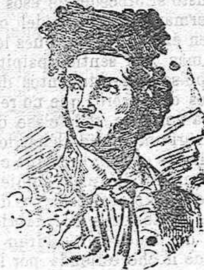
FRANCISCO MONTES (PAQUIRO).