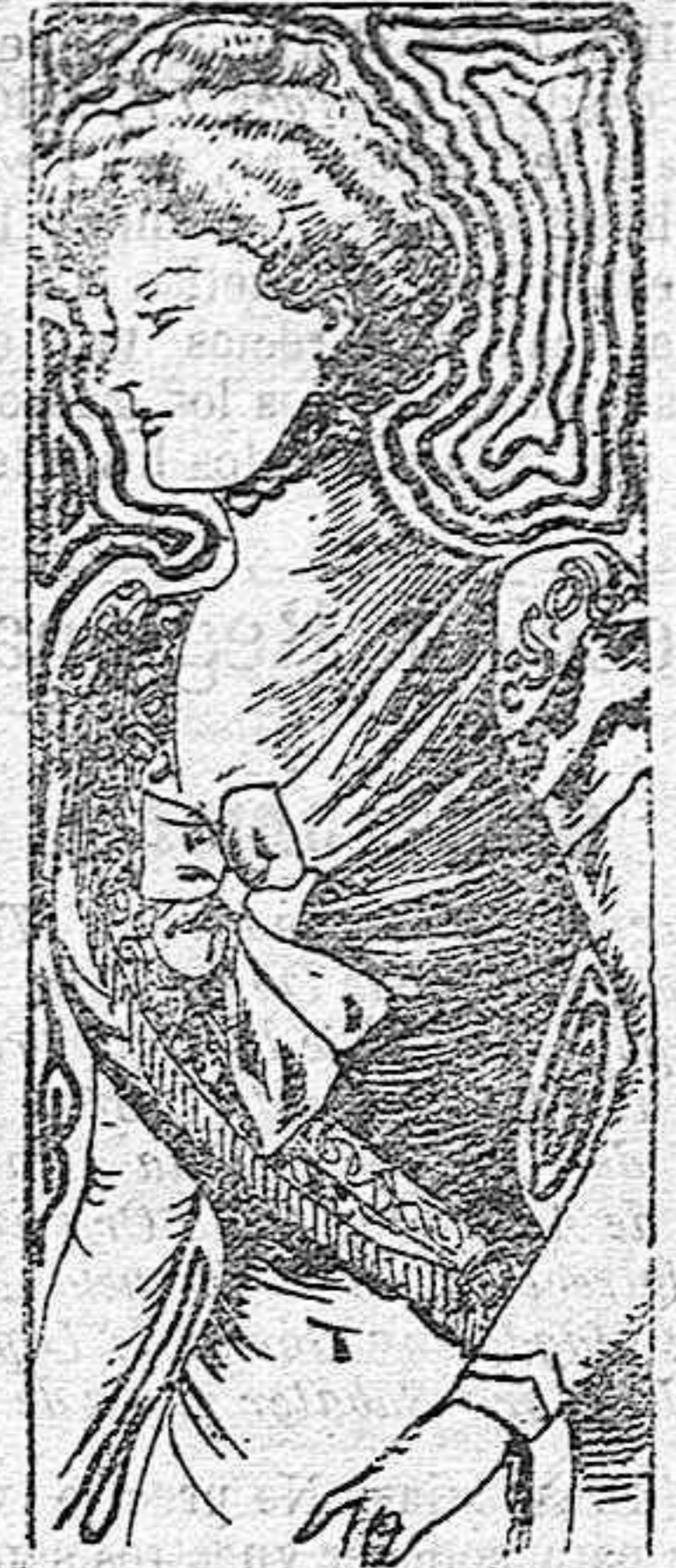
TRAJE PARA SARAO.

Modelos exclusivos para nuestras lectoras de los grandes almacenes de EL SIGLO, Barcelona.