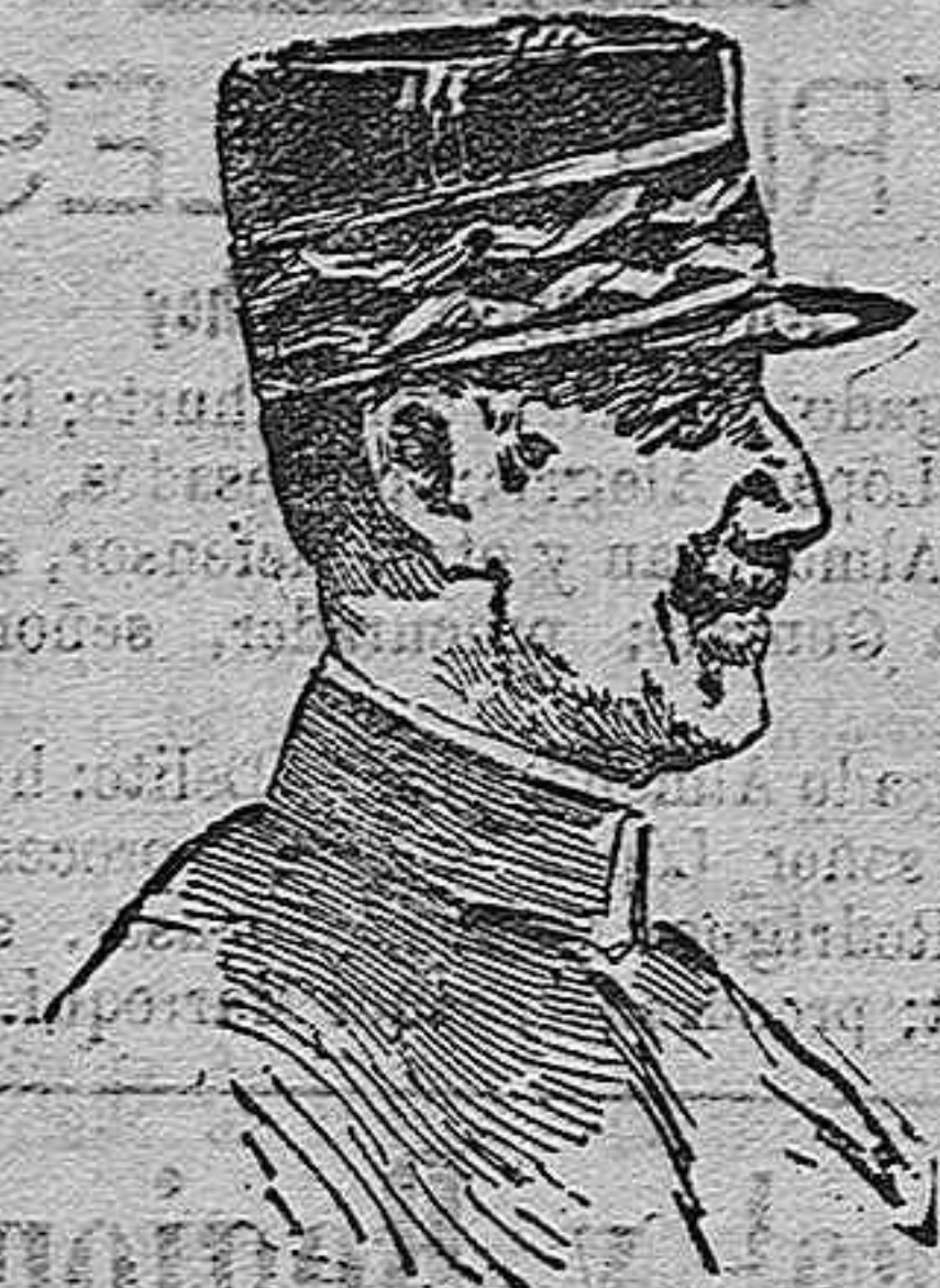
General Cordanier, adjunto del general Serrail y comandante de las fuerzas francesas que se han apoderado de Florina.