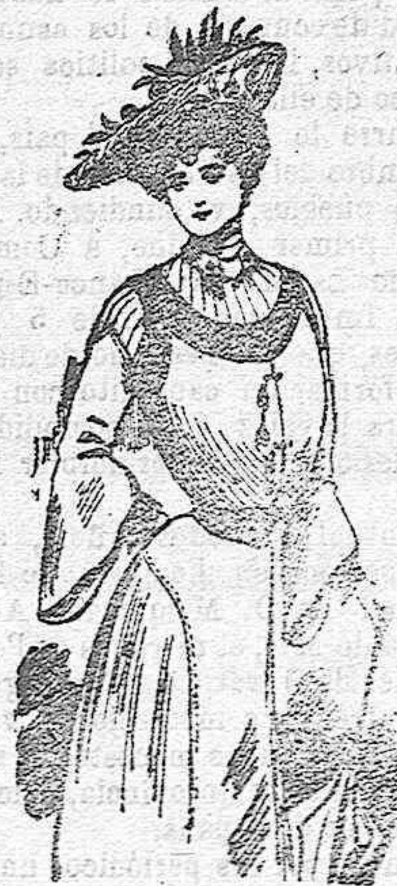
Traje para visita.

De cañamazo, color azul. Cuerpo ajustado, con bonitas garniciones de bordados verdes y azules, en forma de galón, que adornan el pecho y los hombros. Cuello alto, manga perdida, cinturón igual al adorno del cuerpo y falda lisa.