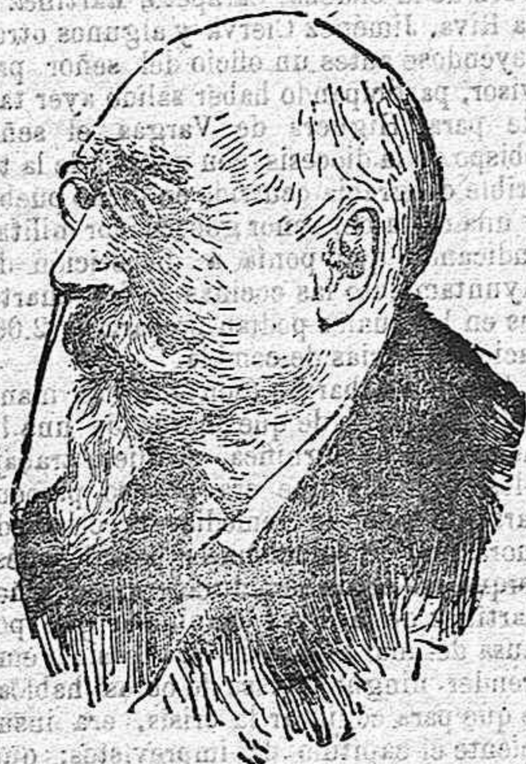
DON JOSÉ ECHEGARAY

Para celebrar el quincuagésimo aniversario de la recepción de su presidente, D. José Echegaray, e imponer al sabio ingeniero D. Leonardo Torres Quevedo la medalla que lleva el nombre de aquel, e instituida, para premiar los altos merecimientos de los grandes científicos, la Academia de Ciencias exactas celebró el domingo solemne sesión, merecedora, por su significación y por los discursos en ella pronunciados, de ser registrada con letras de oro en los anales de esa docta corporación, cátedra de sabios eminentísimos encanecidos en el estudio, crisol porque pasan los tesoros de sabiduría que después han de ser repartidos prodigamente entre los sedientos de saber.