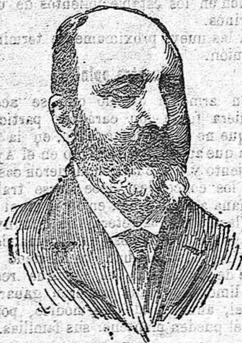
SR. TORRES QUEVEDO

Terminado el hermoso canto a los talentos del Sr. Torres Quevedo, S. M. impuso a éste la medalla, pronunciando después el laureado un notable discurso, en el cual puso de manifiesto su extraordinaria modestia, sólo comparable a su gran valía.