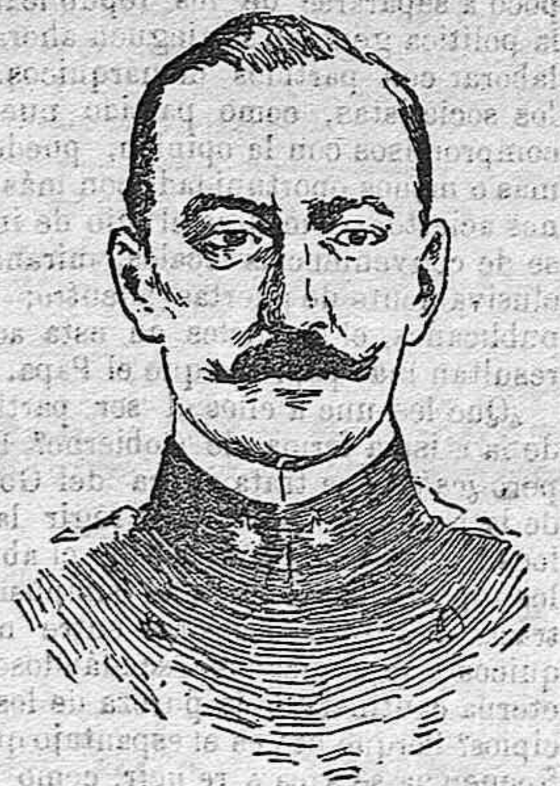
El duque deosta, que manda el ejército italiano que opera sobre el Tirolo