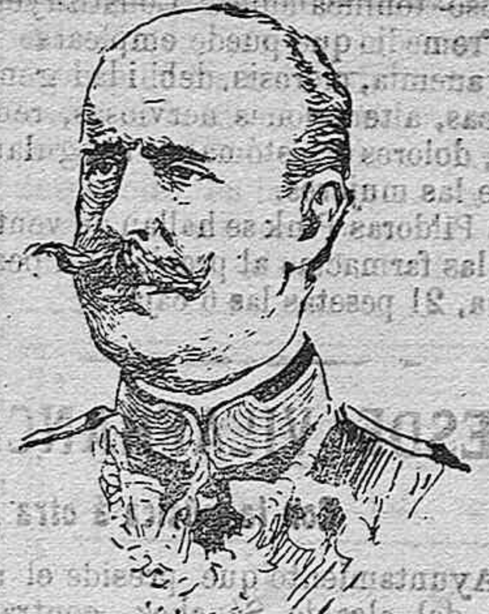
El infante Don Alfonso de Braganza que ha marchado al frente italiano para encargarse de un cuerpo de ejército.