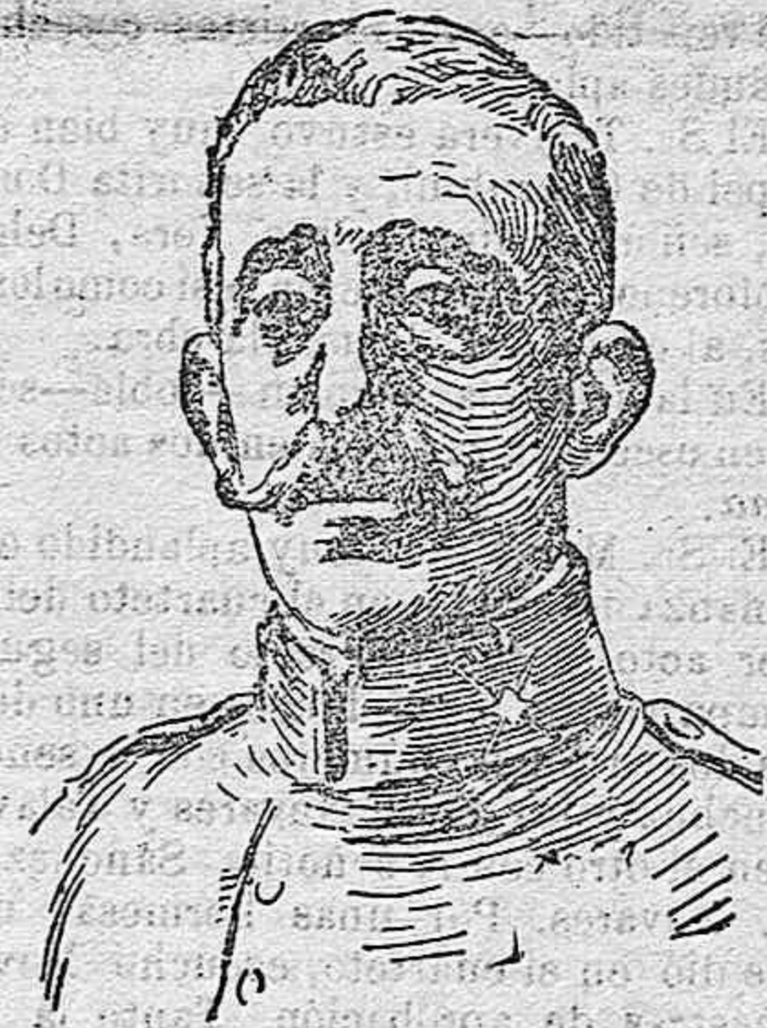
Nombrado comandante general de la plaza de Melilla.