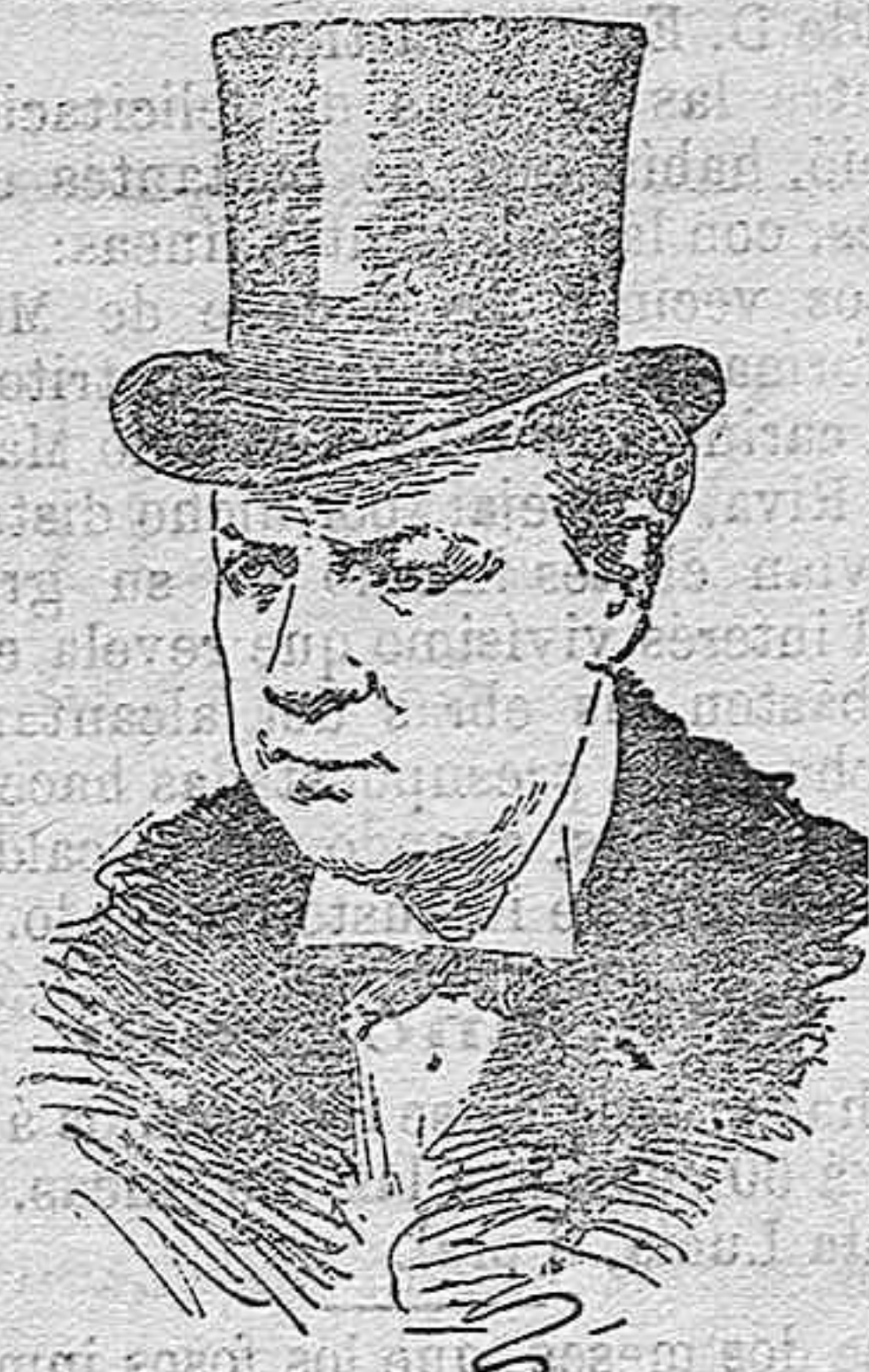
Sir Edward Grey, ministro de Marina de Inglaterra