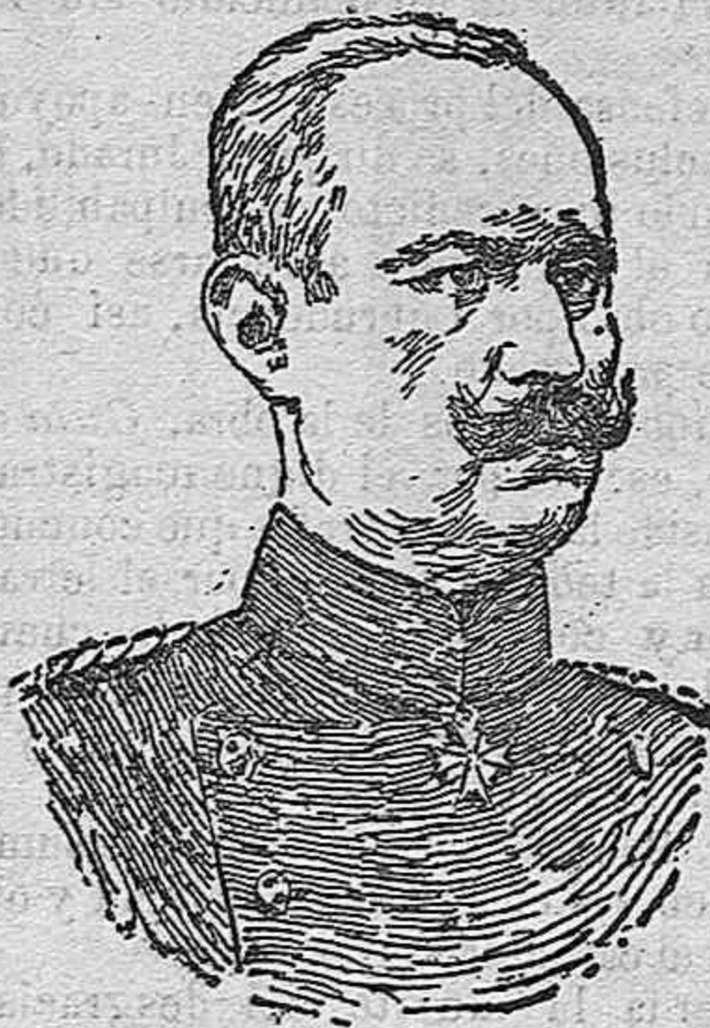
General von Ludendorff, jefe del Estado Mayor del feld-mariscal Hindenburg, que ha sido condecorado con la Rama de Encina, por los servicios prestados en la Prusia Oriental.