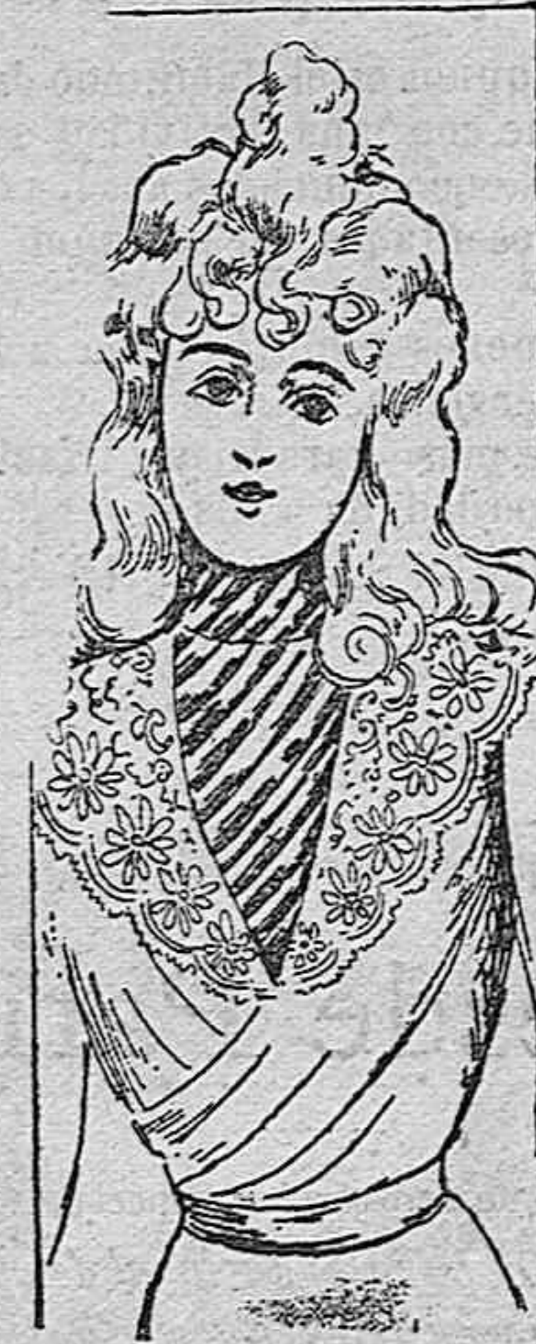
Traje para niña de 12 años.

Modelos exclusivos para nuestras lectoras, de los grandes almacenes de EL SIGLO, Barcelona.