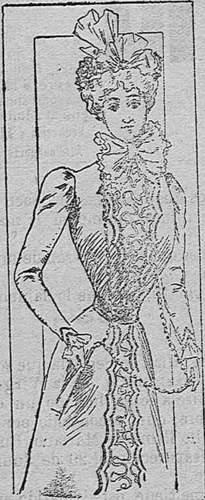
Traje para señorita

Modelos exclusivos para nuestras lectoras, de los grandes almacenes de EL SIGLO, Barcelona.