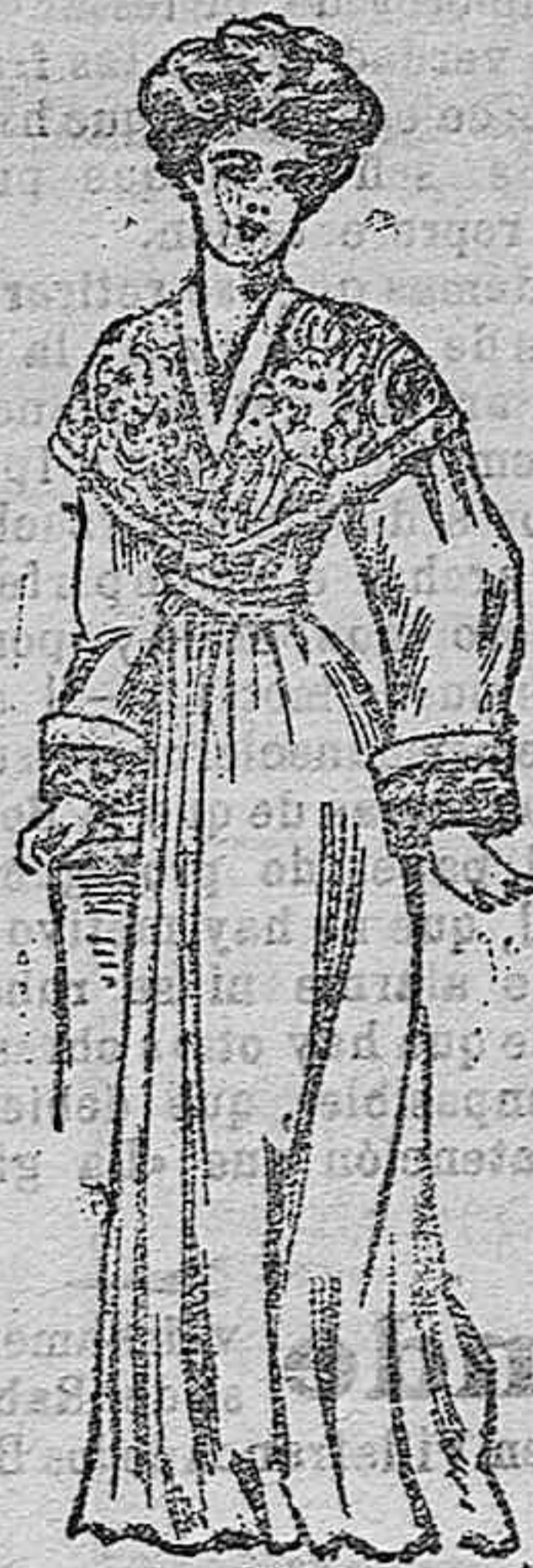
Bata de cachemir con adornos en las bocamangas. Cubre el cuerpo una elegante esclavina de seda con bordado, ligeramente descotada.