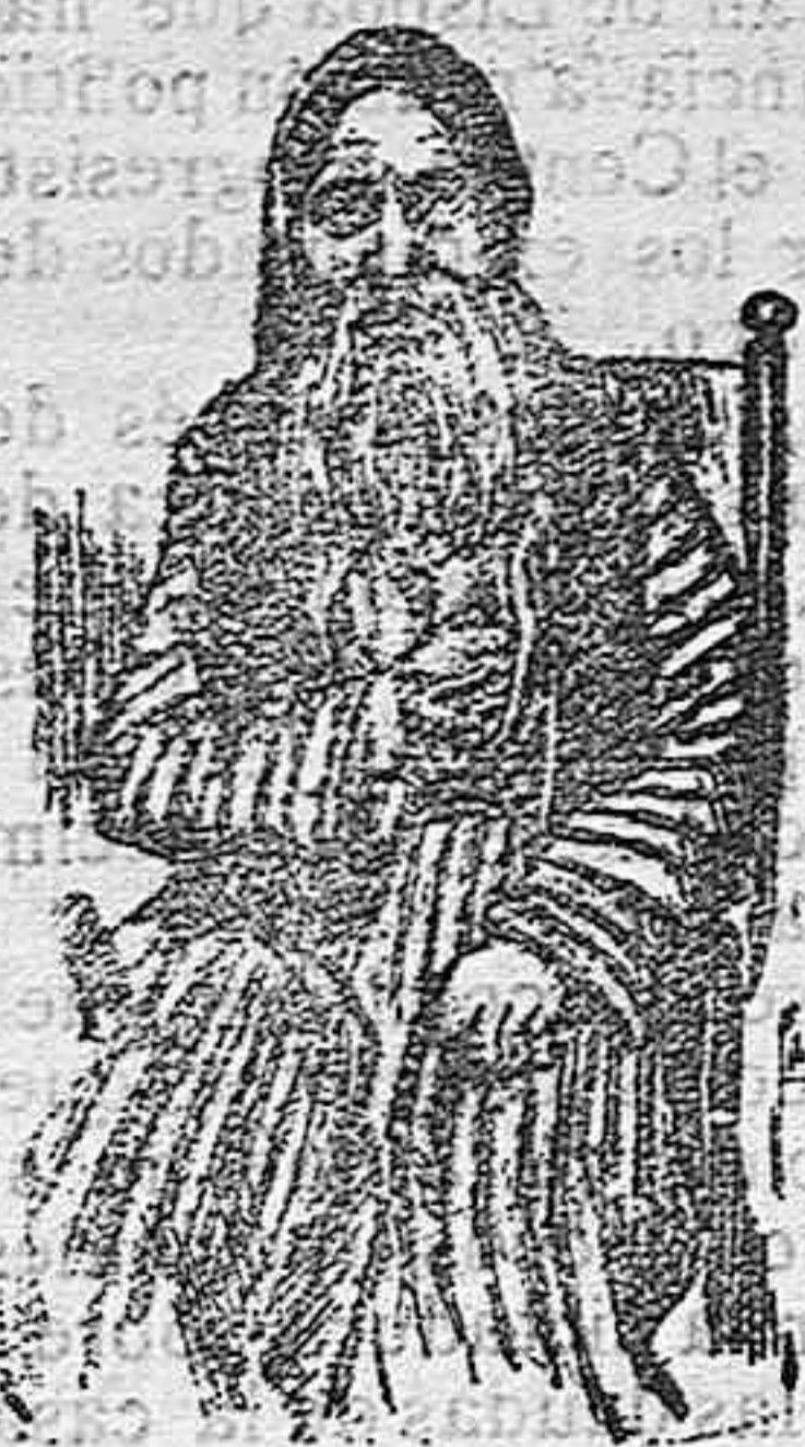
El Gran Rabino de Fez.