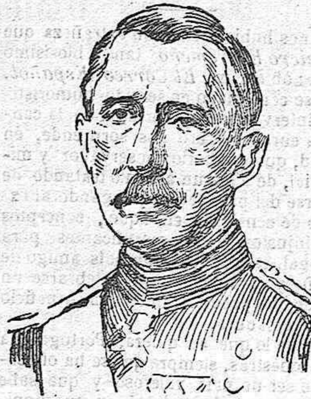
General Leonard Wood, comandante en jefe de las fuerzas norte-americanas que ocupaban Vera- cruz y otras poblaciones mejicanas