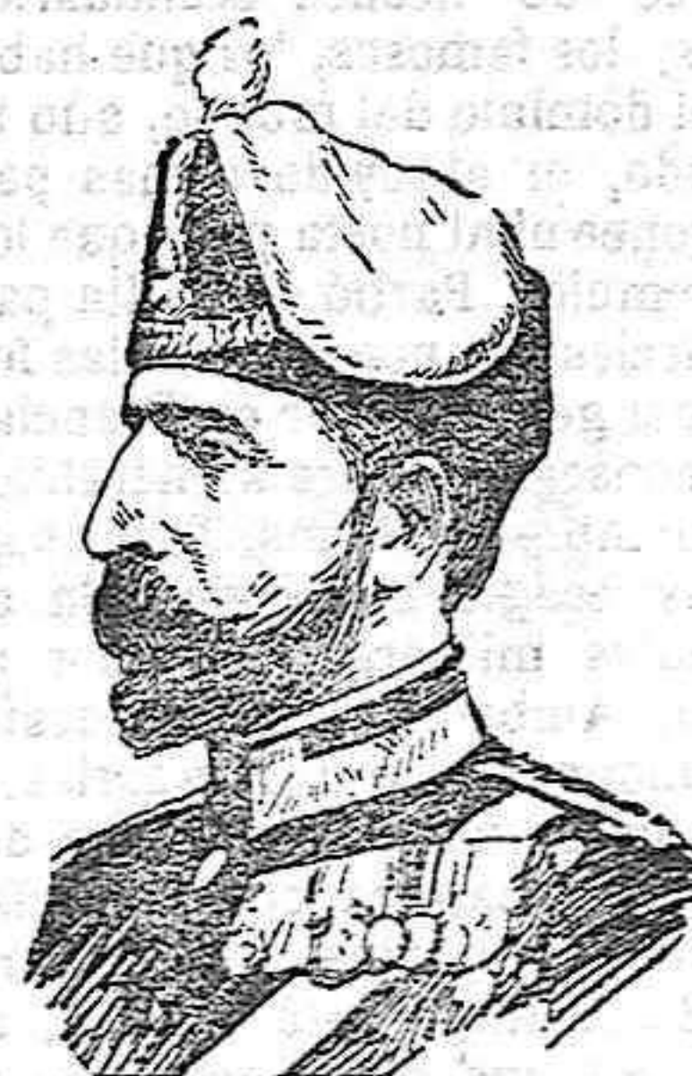
El príncipe Fernando de Hohenzollern Sigmaringen, nuevo rey de Rumania