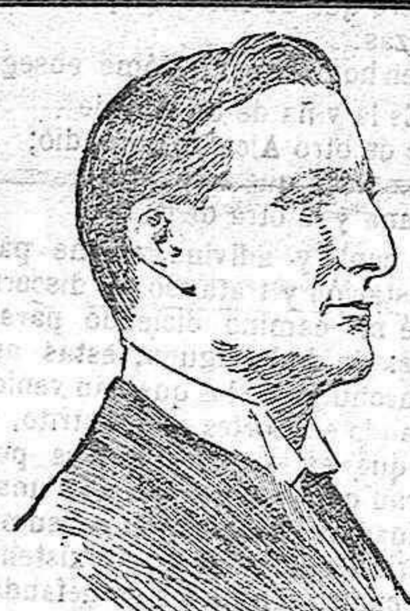
Sir Grey, ministro de Estado de Inglate- rra, autor de la idea de someter el ac- tual conflicto austro-servio á una con- ferencia internacional.

Sin embargo, aún no se ha llamado á declarar á ninguno. En cambio se exami- nó sin demora á ocho ó diez sujetos desi- gnados por los inventores de la sedición. Se informe, pues, el nombramiento de un Juez especial que no esté unido por lazos de amistad ni de gratitud con el conde de Torrepiñares y que tampoco sea capaz de rendir pleitesía al mismo, á fin de que continúe con actividad la instruc- ción de los referidos sumarios. De esa manera es más fácil que resplandezca la verdad y se imponga en su día el castigo que proceda á los autores de los sucesos ocurridos en Cabeza de la Vaca la noche del 5 de Julio y que costaron la vida al desdichado Dámaso Lemus.