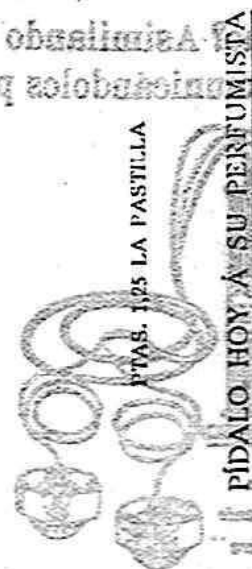
PIDALO HOY A SU PERFUMISTA

EL NUEVO JABÓN FLORES DEL CAMPO ES UN PRODUCTO CIENTIFICO QUE LA PERFUMERIA FLORALIA OFRECE A LA COQUETERIA FEMENINA