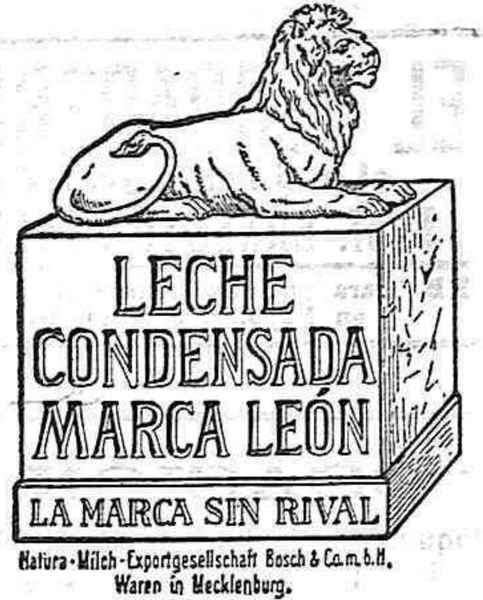
Natura-Milch-Exportgesellschaft, Bosc & Co. m. b. H., Waren in Mecklenburg.