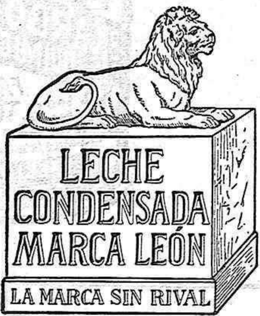
Natura-Milch-Exportgesellschaft Bosch & Co. m. b. H. Waren in Mecklenburg.