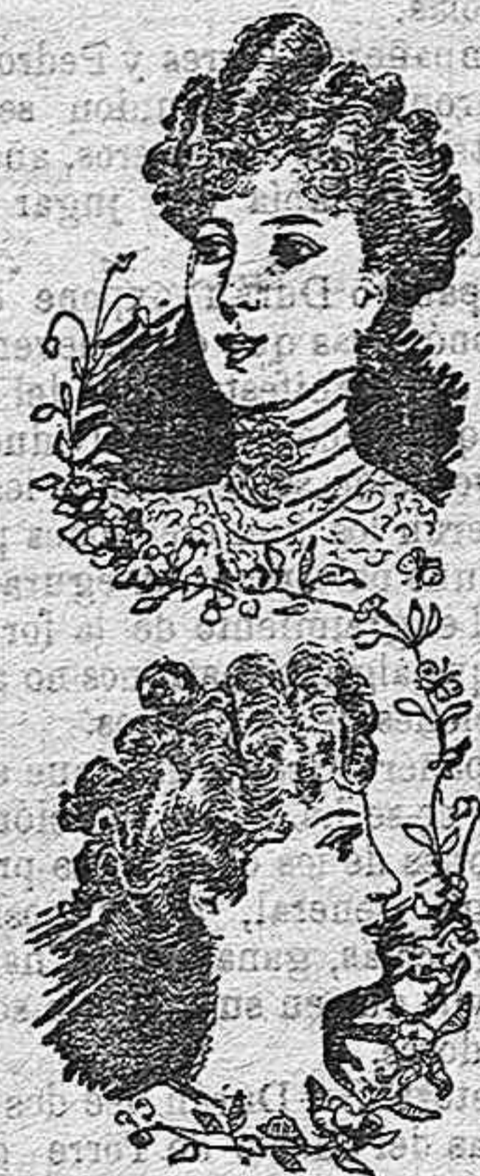
Modelos de peinados.