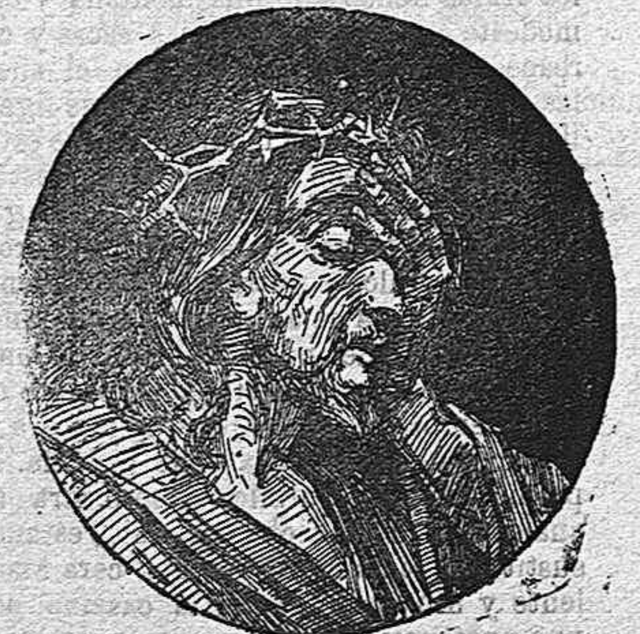
JESUS CORONADO DE ESPINAS.