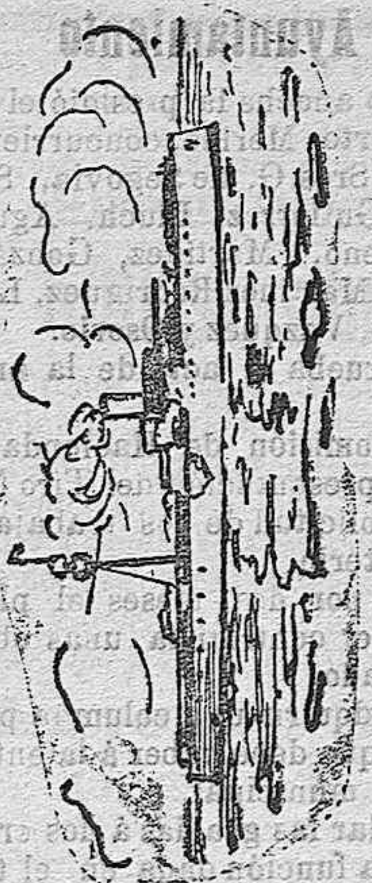
Crucero - Critruspi Marina rusa.