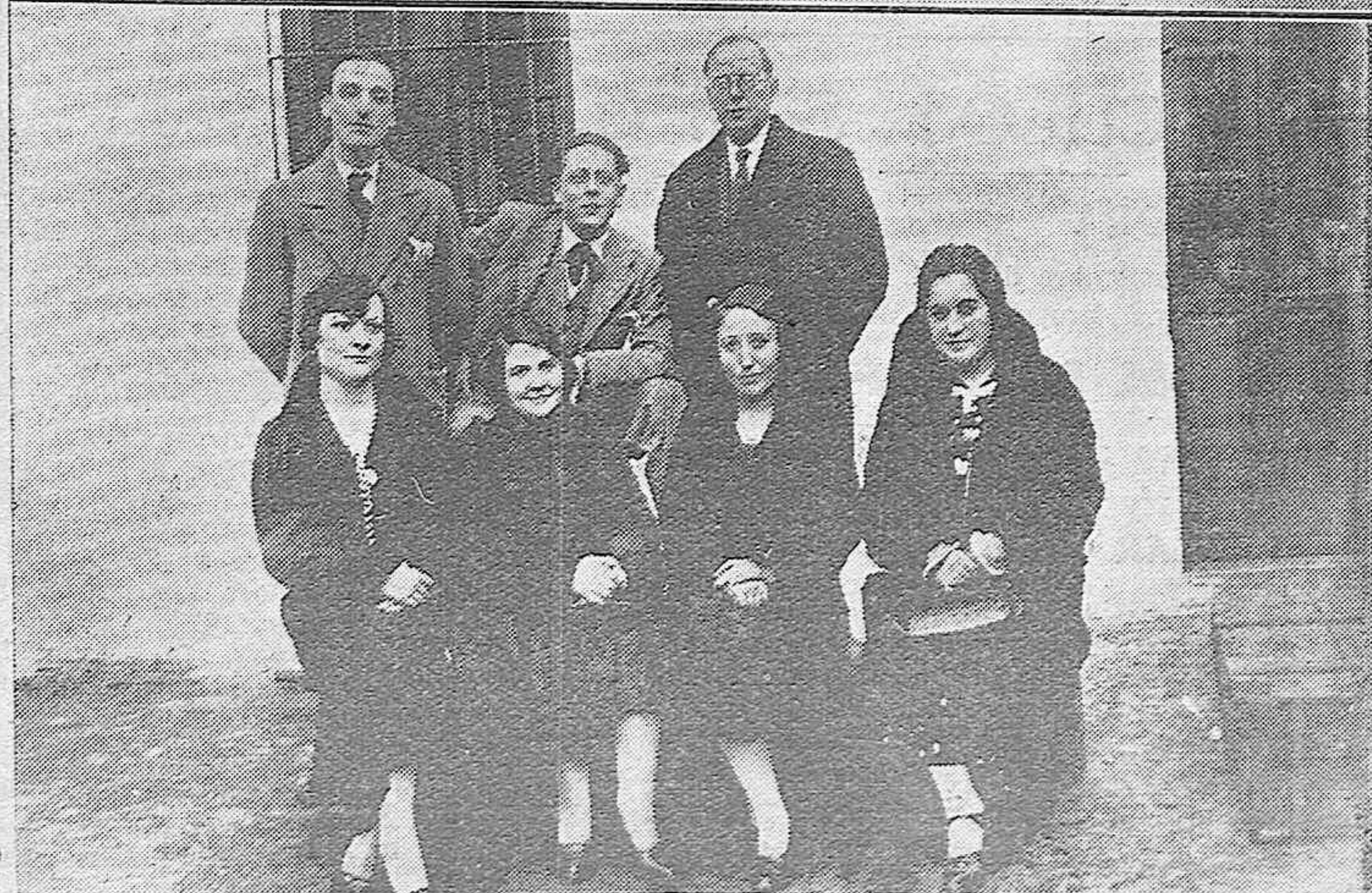
El gobernador civil señor Gardoqui en unión de otras personas viendo los terrenos donde se ha de levantar el nuevo Cuartel de la Guardia civil en Villaviciosa de Córdoba.—Los maestros nacionales del mencionado pueblo que se encontraban allí durante los sucesos revolucionarios.