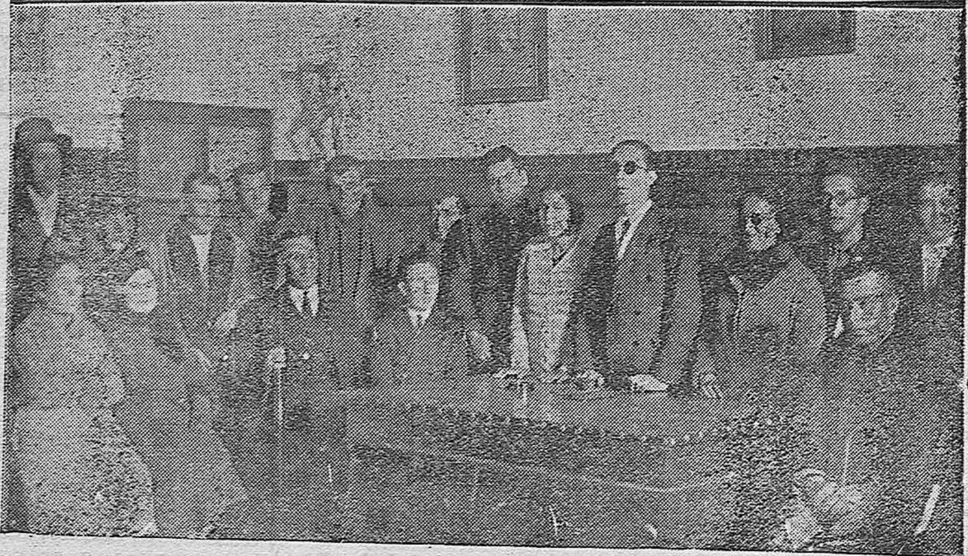
NOTAS GRAFICAS.—Asistentes al banquete que celebraron los drogueros.—Se organiza la Asociación de ciegos.—Presidencia de la Asamblea