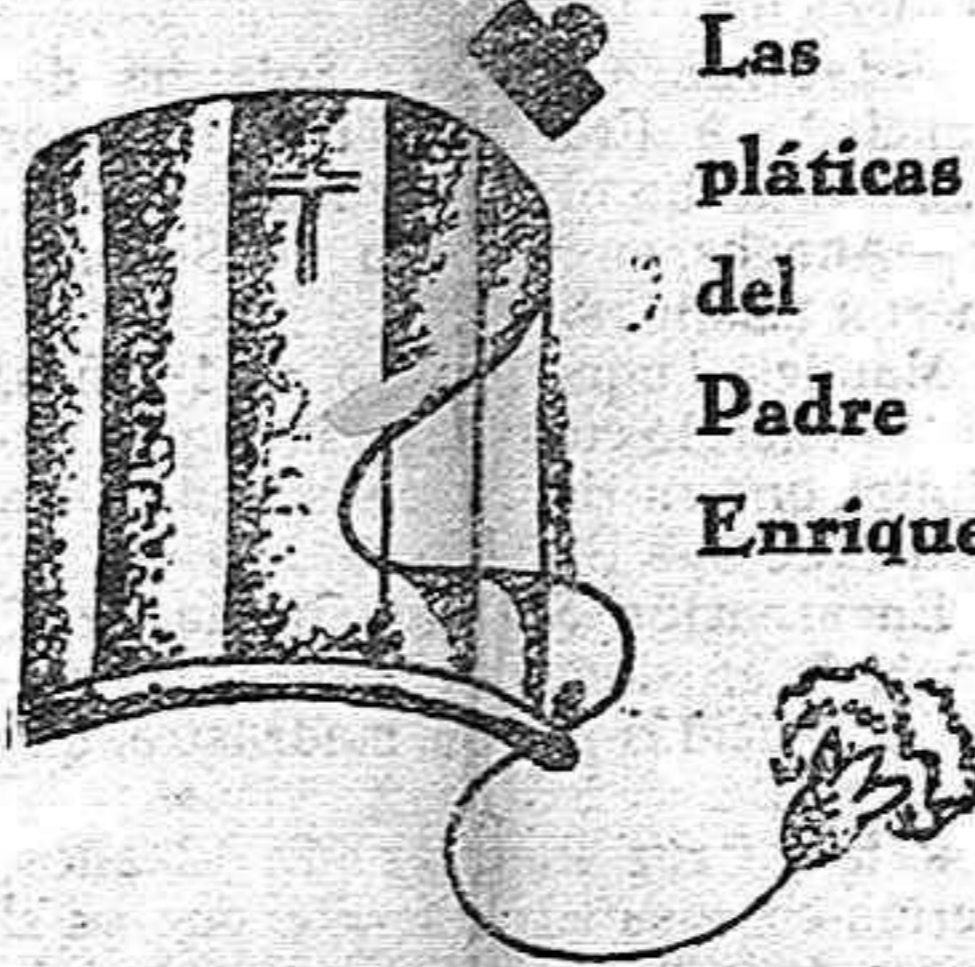
Las pláticas del Padre Enrique

En Valparaíso los comunistas han sostenido un encuentro con las fuerzas de desembarco de la armada, resultando varios muertos y heridos.