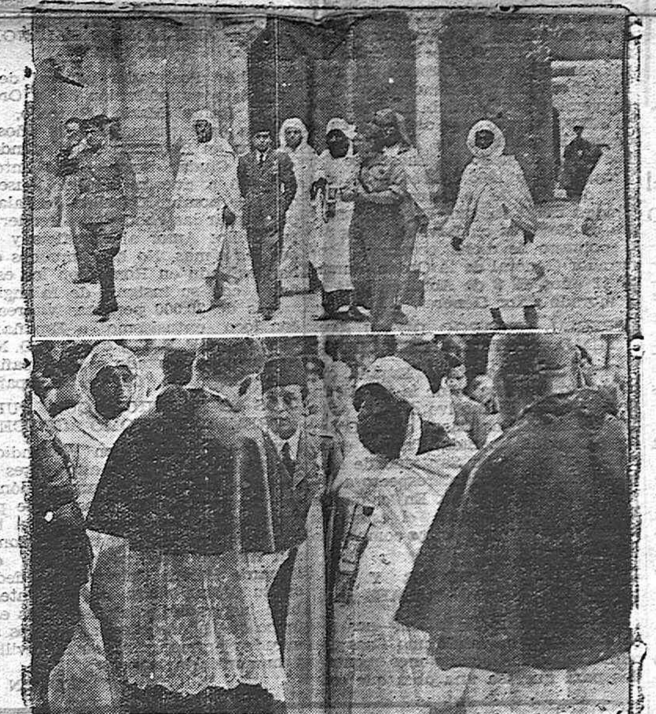
El Sultán Azul visita la Mezquita-Catedral