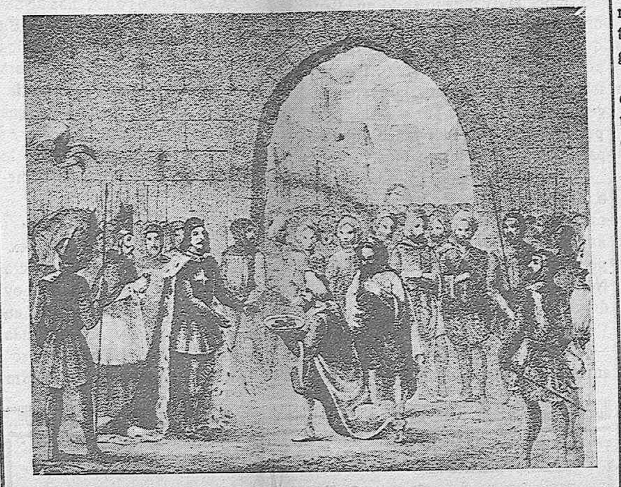
El Rey San Fernando recibe de mano de los infieles las llaves de Córdoba (Del grabado de un libro del Marqués de Cabriñana).