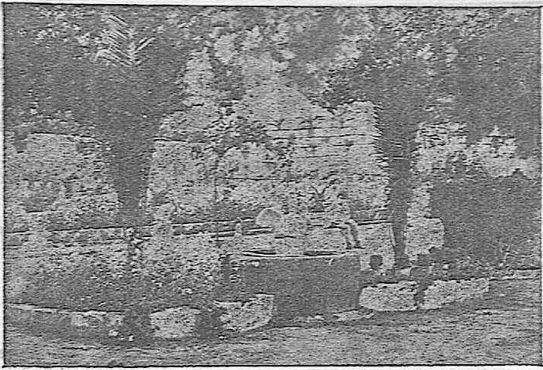
Una vista del jardín del Alcazar