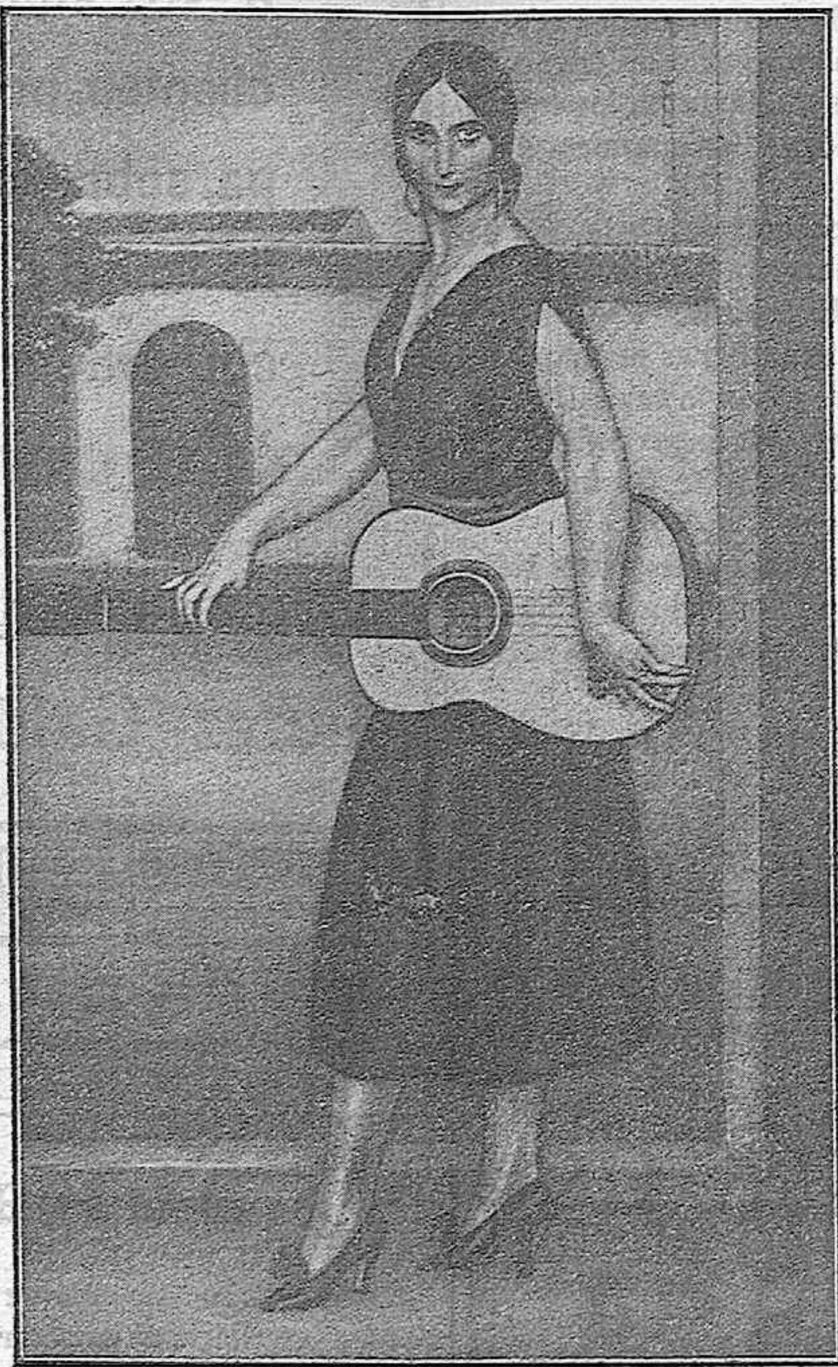
Cuadro de Julio Romero de Torres

cas de puro pasto, susceptibles de una progresión en alza de su producción económica, exclusivamente pesuaria, a fuerza de majadearlas constantemente, se han roturado, contra lo dispuesto en los decretos y lo dictado por la razón, estos «mejadales», que al ser destruidos podrán producir todo lo más, si las lluvias son abundantes, una o dos cosechas, pero quedarán luego, en su totalidad, absolutamente improductivos durante largos años; se han destruido explotaciones ganaderas, con disminución de un treinta y cinco al cienenta por ciento del ganado existente en estas provincias, se ha obligado a malvender este ga-