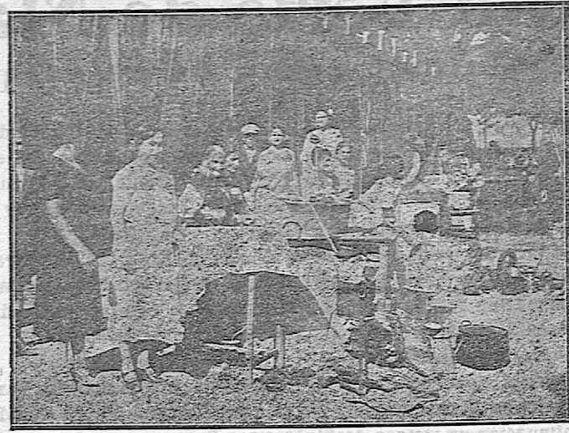
Una antigua y típica huñolera

Motivo fundamental de la iniciación de estos asentamientos fué «la improductividad forzada del capital móvil consistente en yuntas, con su obligado sostenimiento, por falta de tierra en la que aplicar la destacada capacidad del pequeño empresario agrícola»; falacia inserta en la exposición del primer decreto y comprobada en la ejecución de éste y de su hermano menor; del total de asentados sólo un muy reducido tanto por ciento era y es, en realidad, ese tan decantado «pequeño empresario agrícola» y el resto, es decir, la casi generalidad eran y son campesinos simplemente, jornaleros poseedores de una o dos caballerías menores—alguno de ninguna—y a los que bruscamente se les ha eleva-