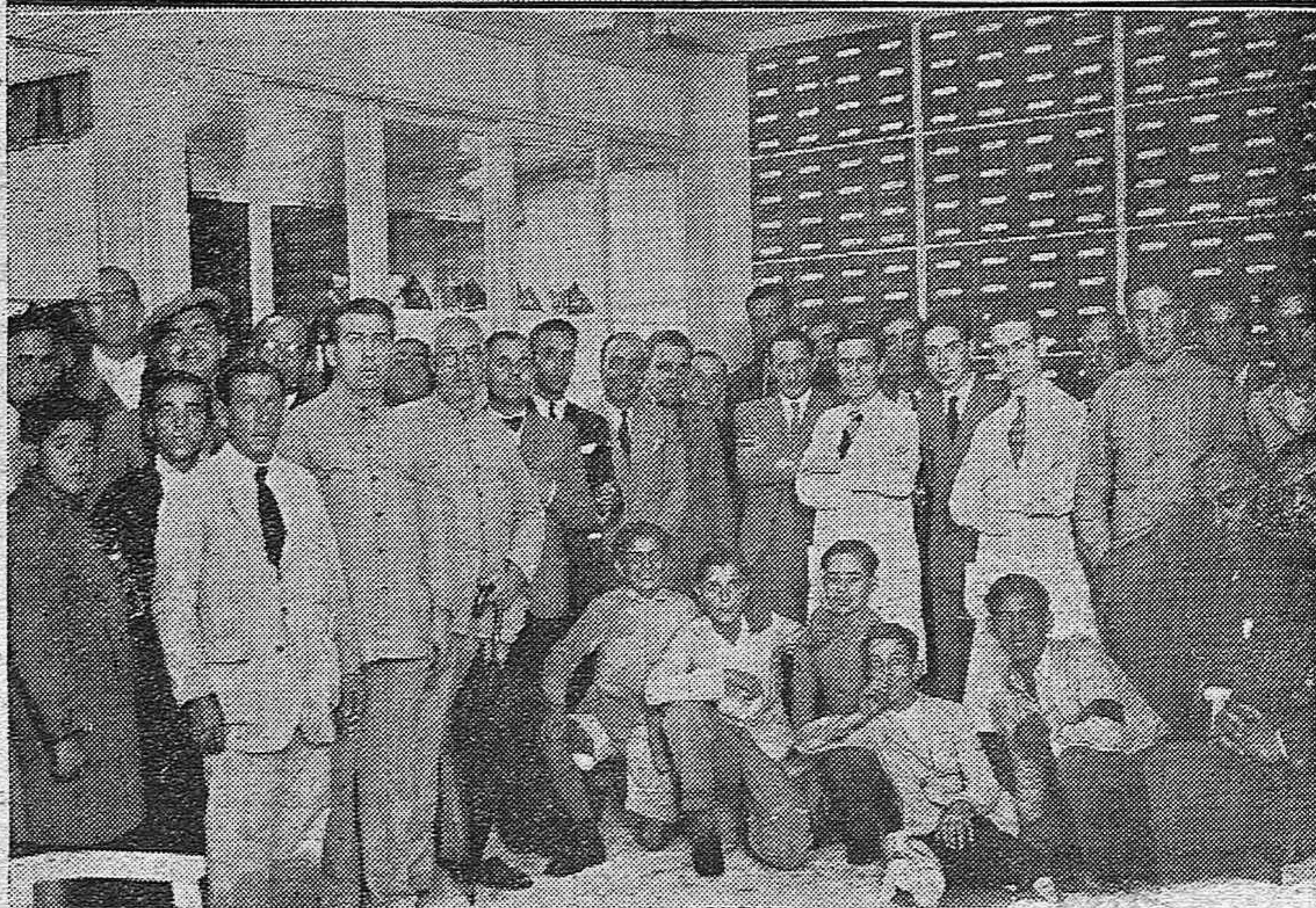
NOTAS GRAFICAS. —Asamblea de Ingenieros de Caminos, Canales y Puertos de la Region Sur de España celebrando después con este motivo un banquete en el Círculo de «La Amistad».—Un detalle de la inauguración del comercio de calzados Ciudad del Betis celebrada anoche.