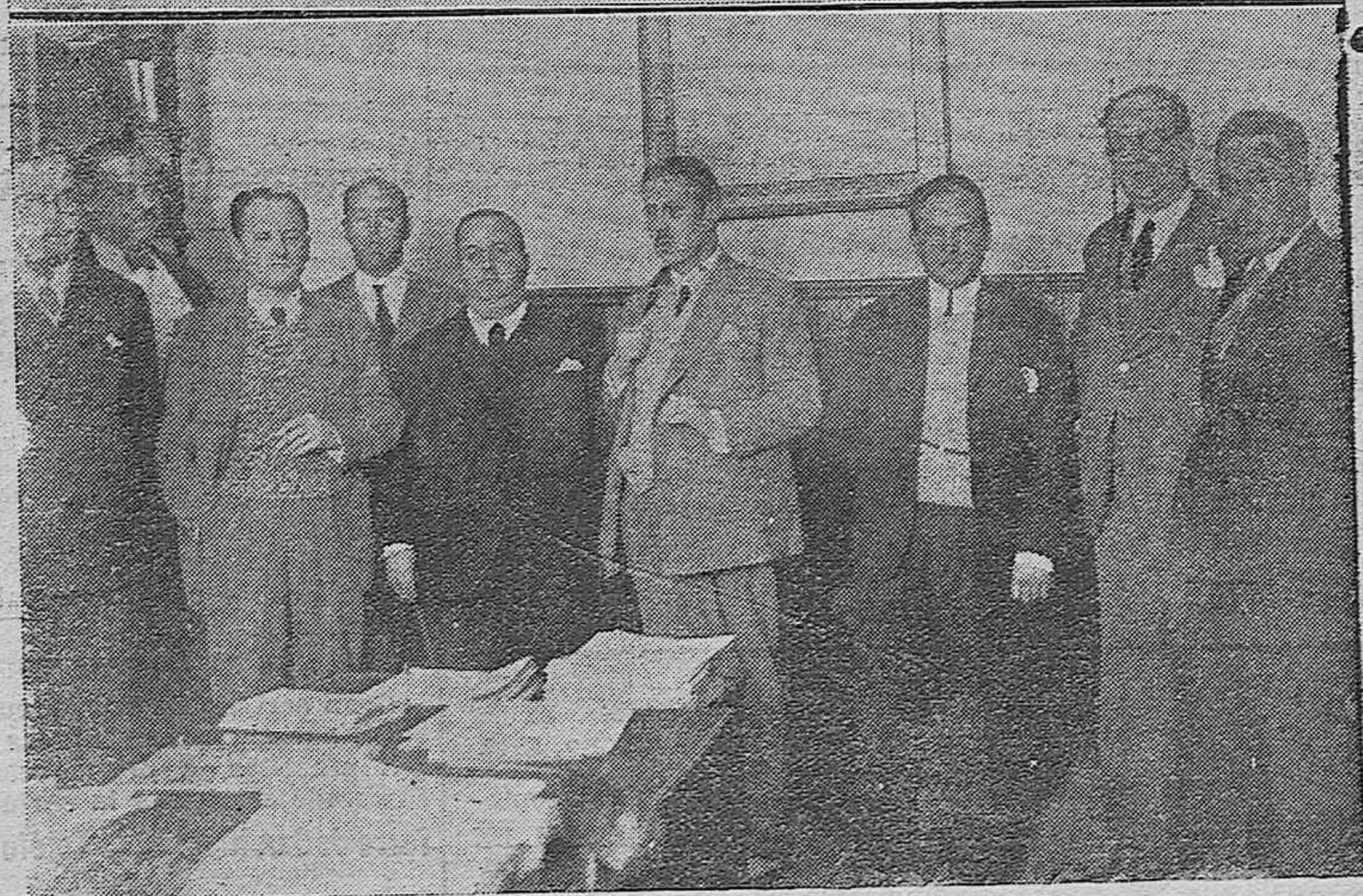
NOTAS GRAFICAS. —La Junta del monumento a Julio Romero de Torres presidida por el gobernador civil que se reunió anoche en el Gobierno.—La Comisión de Monumentos reunida en pleno en el Instituto Nacional donde tomaron importantes acuerdos relacionados con la Zona Artística.