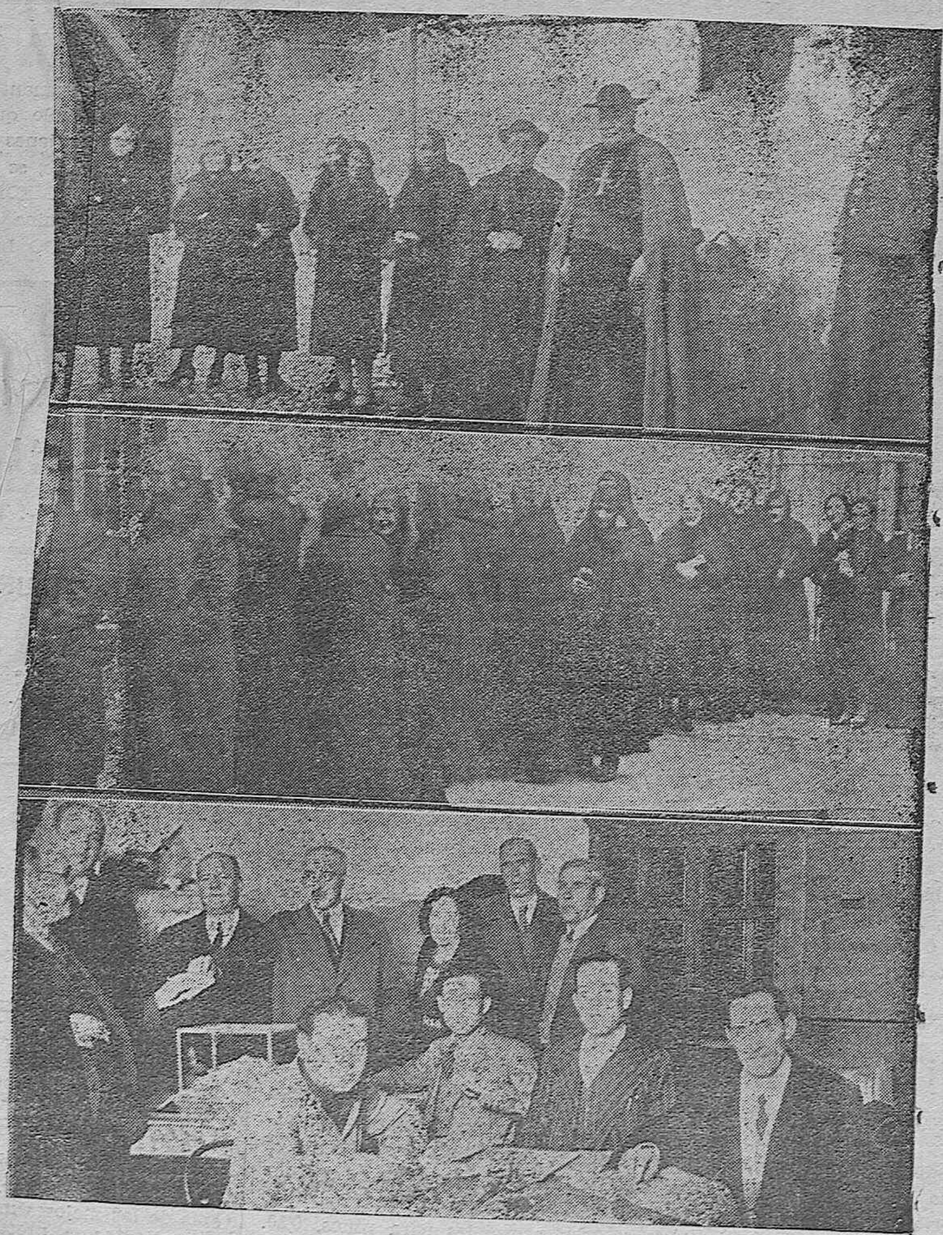
NOTAS GRAFICAS.—El señor Obispo de la diócesis formando "cola" desde antes de las ocho de la mañana. —Otros detalles de la elección celebrada ayer.