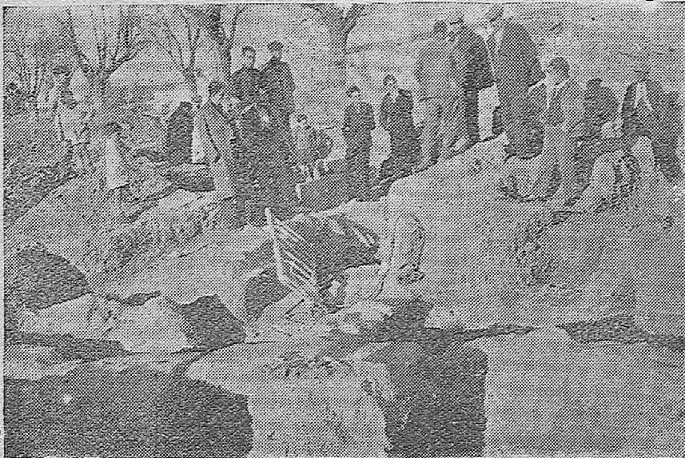
Vista de la entrada al Aljibe árabe.

Don Enrique Romero de Torres, nos manifiesta que también hallaron restos de madera, muy pocos, y esto indica, que los difuntos eran sepultados en féretros, y que la tierra los redujo a través del tiempo a cenizas.