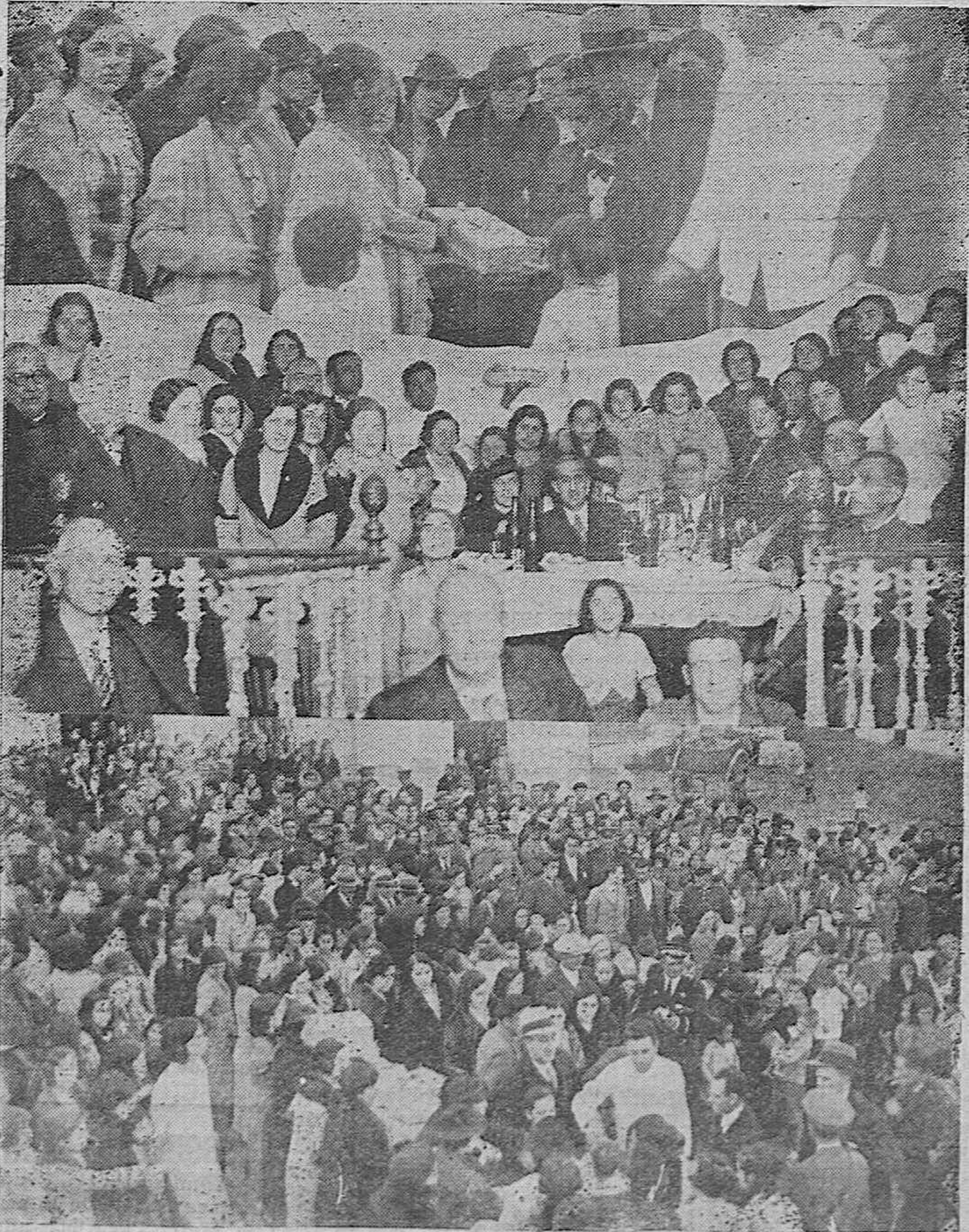
Varios detalles del reparto de ropas a los hijos cuyos padres están presos con motivo de los pasados sucesos en Villaviciosa de Córdoba y cuya suscripción ha sido organizada por la distinguida señora del gobernador civil de Córdoba señor Gardoqui, asistiendo las autoridades provinciales y locales.