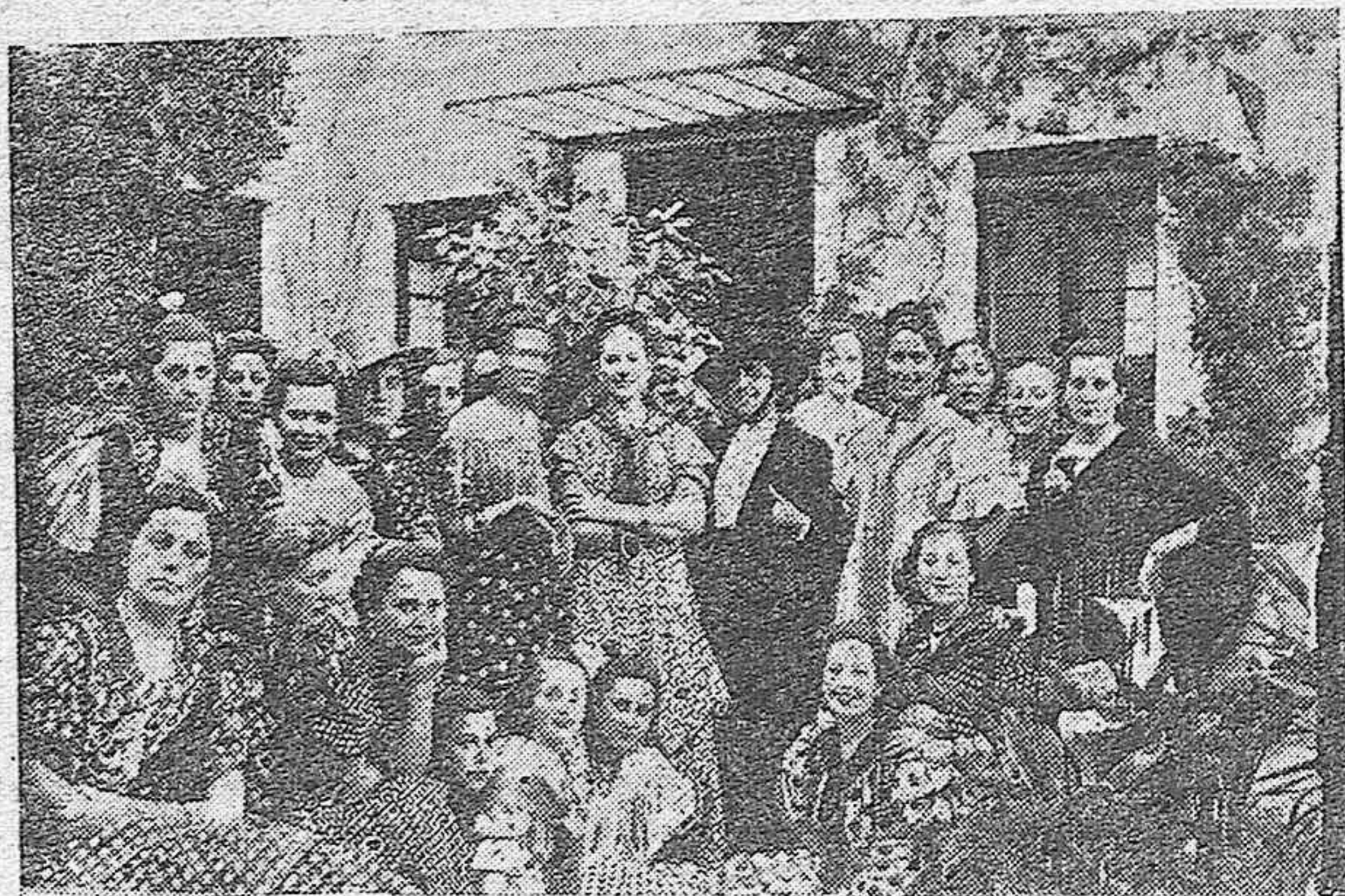
La juventud femenina cordobesa, ataviada a la andaluza, esperando al Generalísimo.