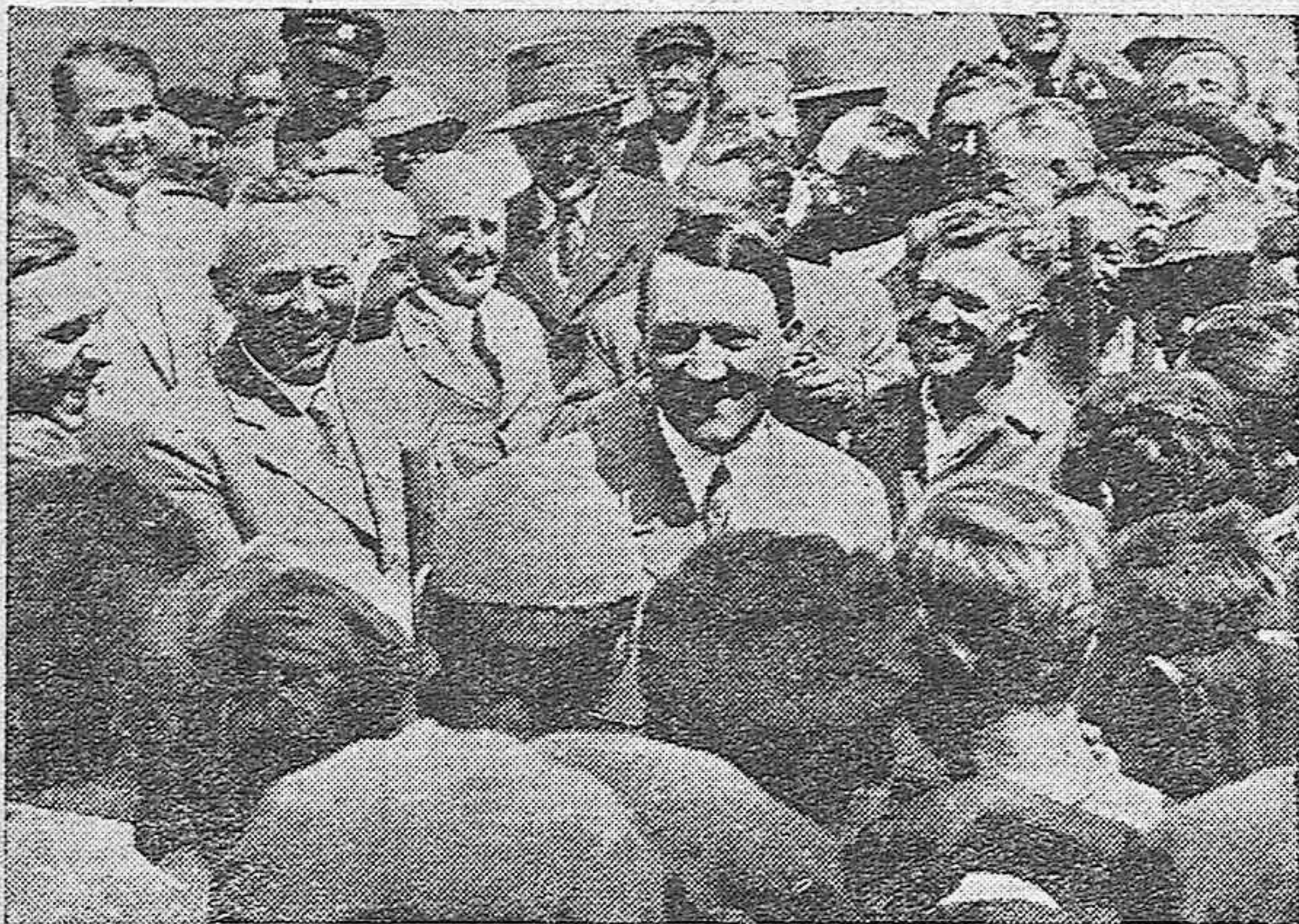
El Führer Adolfo Hitler, celebrará su cumpleaños mañana 20 de Abril. La foto presenta al Führer hablando alegremente con algunos obreros del ramo de Construcción

Alemania fuerte, Alemania pacífica. Y Adolfo Hitler, después de sus fatigosas tareas de hombre de Estado, a raíz del discurso que ha pronunciado recientemente en Wilhelmshaven, ha querido compartir su ocio brevemente con los obreros, que, para celebrar su temporada de vacaciones, se encontraban a bordo del nuevo «Robert Ley». Allí, en medio de la alegría sana y cordial de estos hijos del pueblo, Adolfo Hitler ha permanecido más de veinticuatro horas. Volverán los días de trabajo para todos estos hombres, y el Führer no dejó pasar mucho tiempo sin reintegrarse a las ocupaciones que cada hora le proporciona. Por encima, de las incertidumbres flotará siempre en el ánimo de los alemanes, como una temperatura benéfica, la conciencia íntima de esta compenetración de hermandad, nacida de la serenidad y de la salud del espíritu. Esa misma serenidad que ha sabido dictar un hombre, el cual presidirá las tareas del futuro Congreso del Partido—el Partido Nacional socialista, la gran obra fundamental de Hitler—que ha de celebrarse el próximo mes de Septiembre en la ciudad de Nuremberg. Como todo el mundo sabe, el Congreso de este año se titulará «Congreso de la Paz».