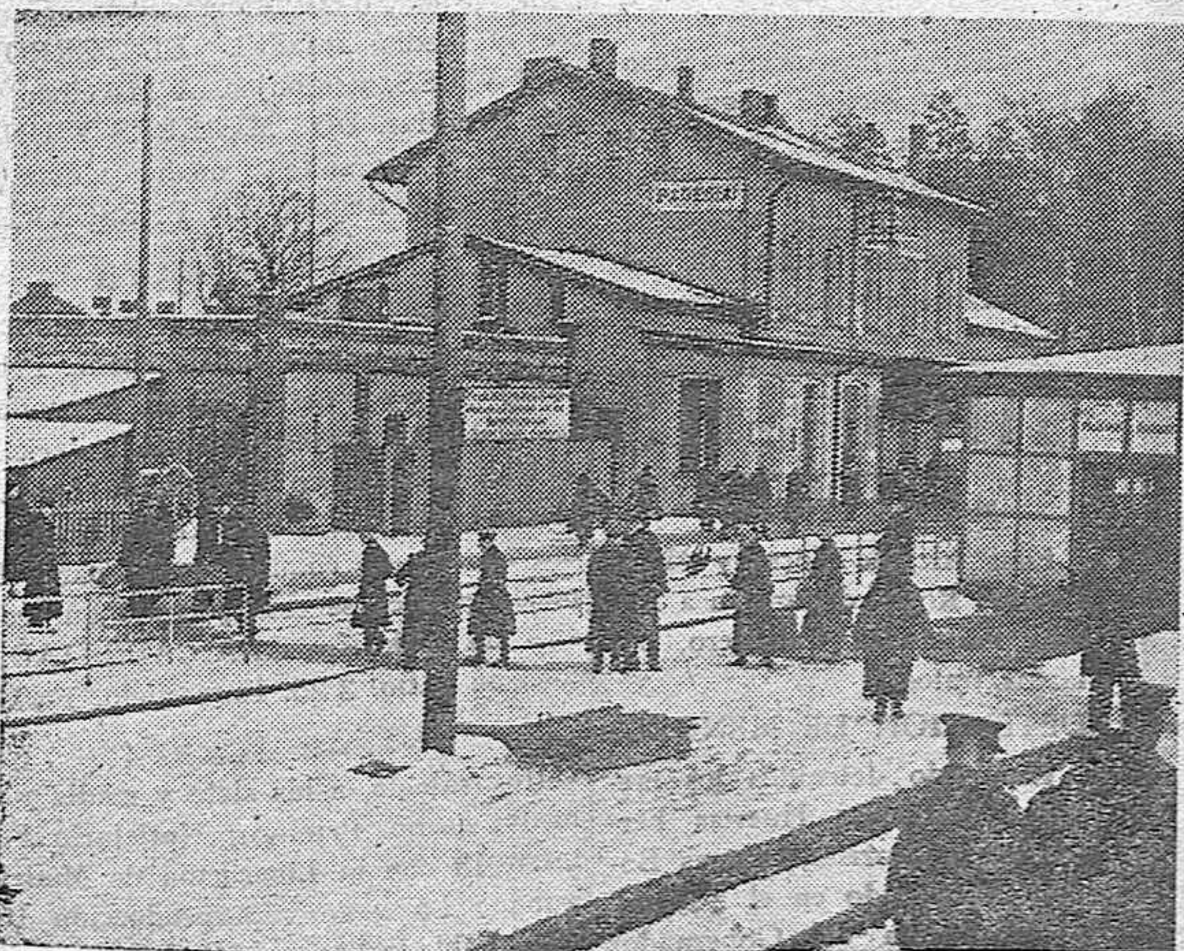
La ciudad fronteriza de Pogegen, que los lituanos bautizaron con el nombre de Pagegiai, después de haber sido arrancada a Alemania por el dictado de Versalles.