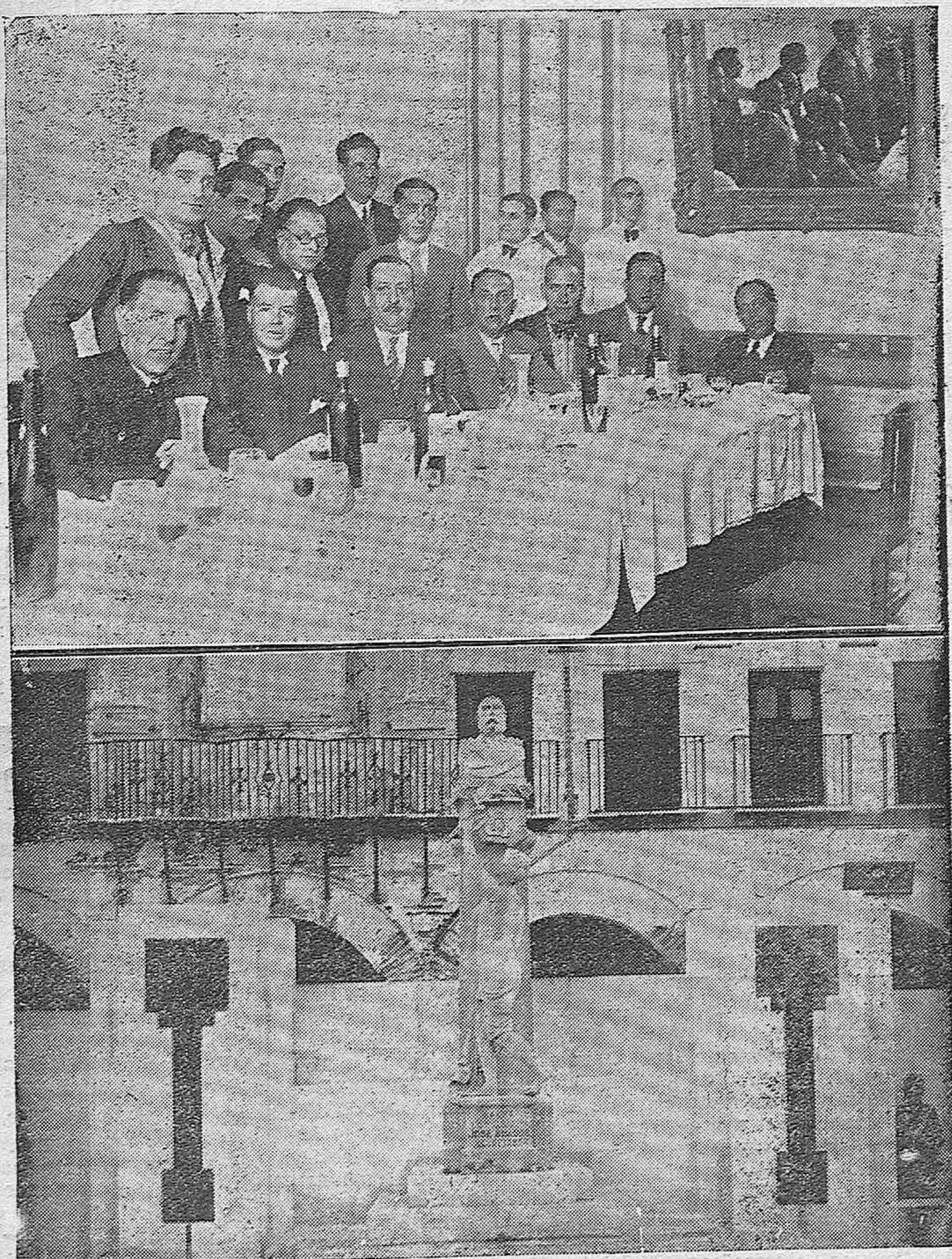
NOTAS GRAFICAS.—Banquete celebrado por los practicantes de la beneficencia provincial para festejar la importante mejora concedida por la Diputación provincial.—Nuevo emplazamiento del monumento a Fernández de los Ríos que le ha dedicado su pueblo natal de Baena en el paseo central del mencionado pueblo.