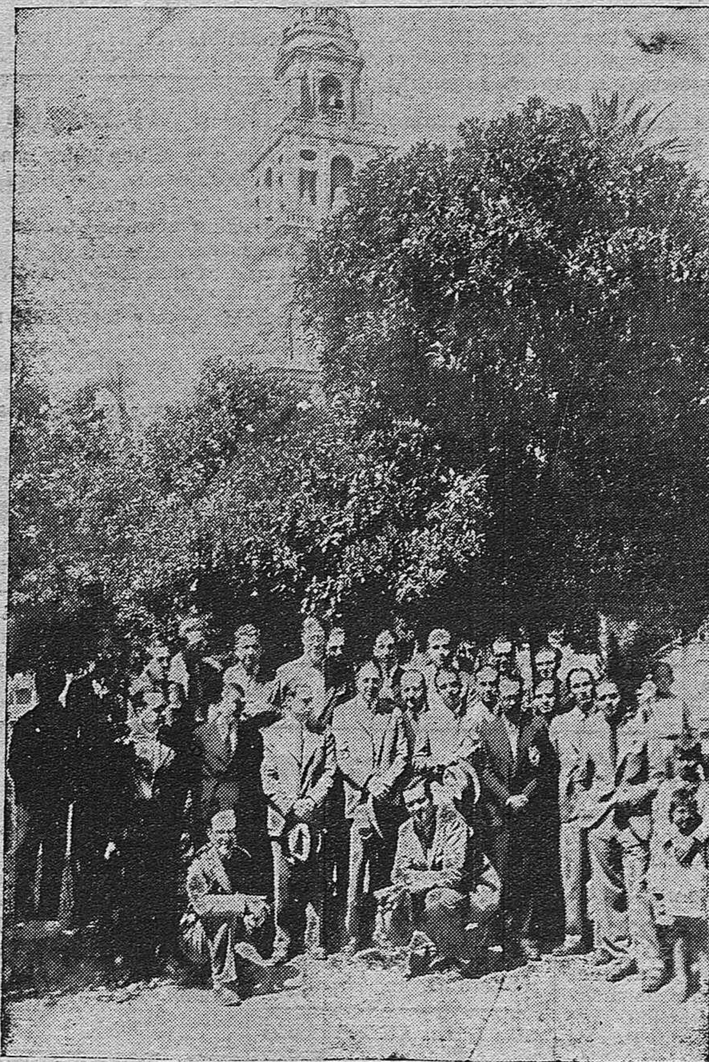
NOTA GRAFICA.—Los excursionistas catalanes que han visitado Córdoba, saliendo de la Mezquita Catedral.