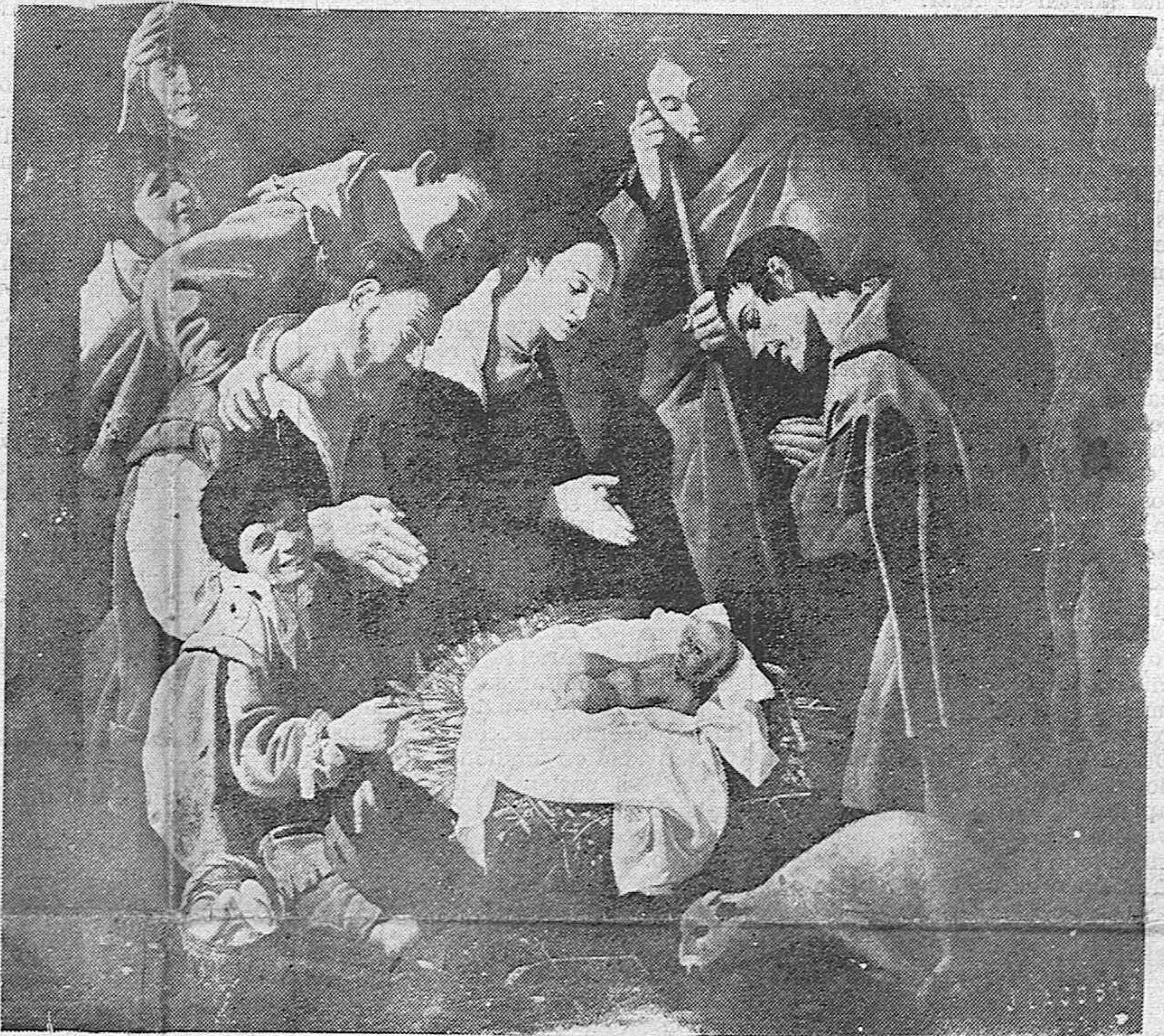
Notable cuadro del pintor del siglo XVII, José de Saravia que se conserva en el Museo Provincial de Bellas Artes de Córdoba