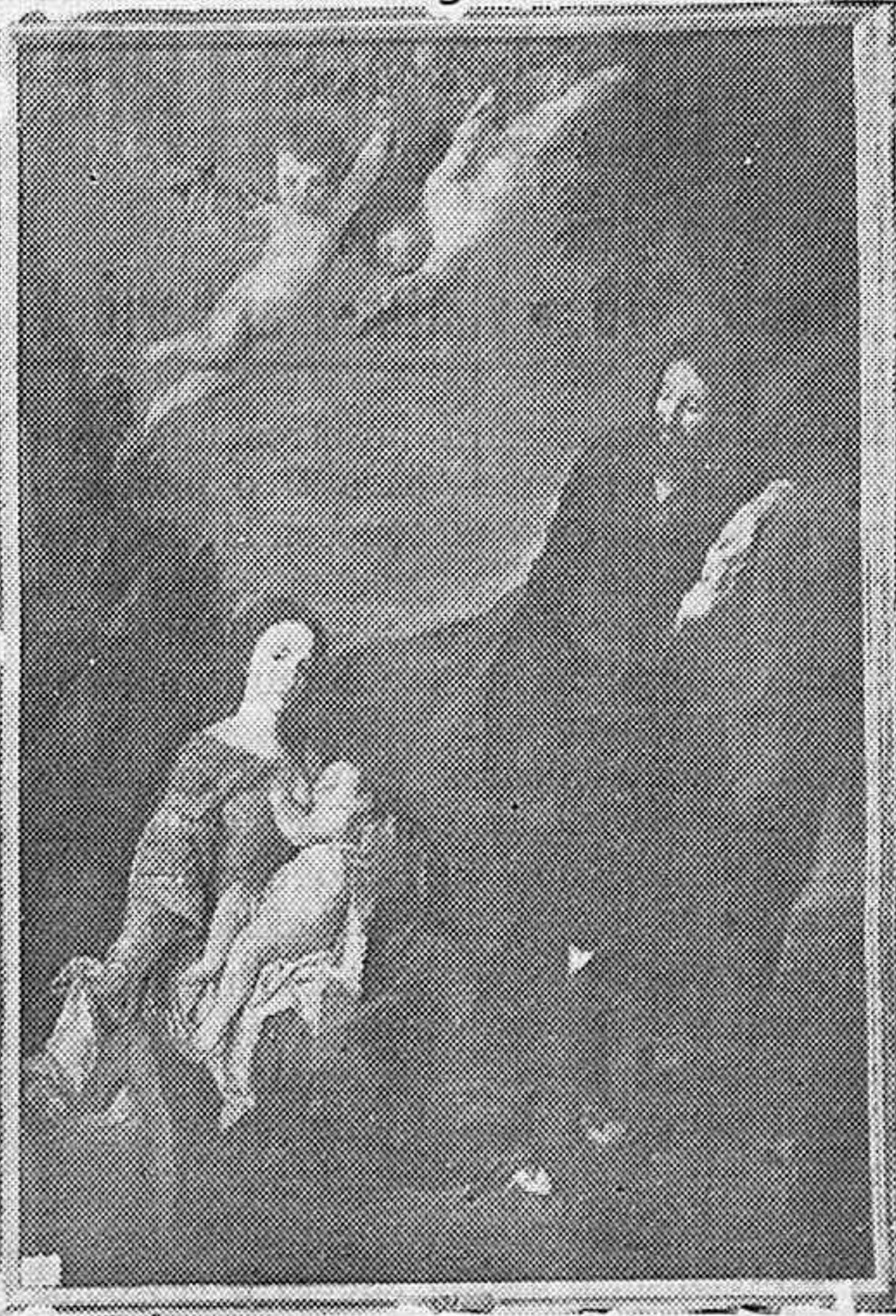
Admirable lienzo de Ribera (El Españolito) que se conserva en el Museo Provincial de Bellas Artes de Córdoba