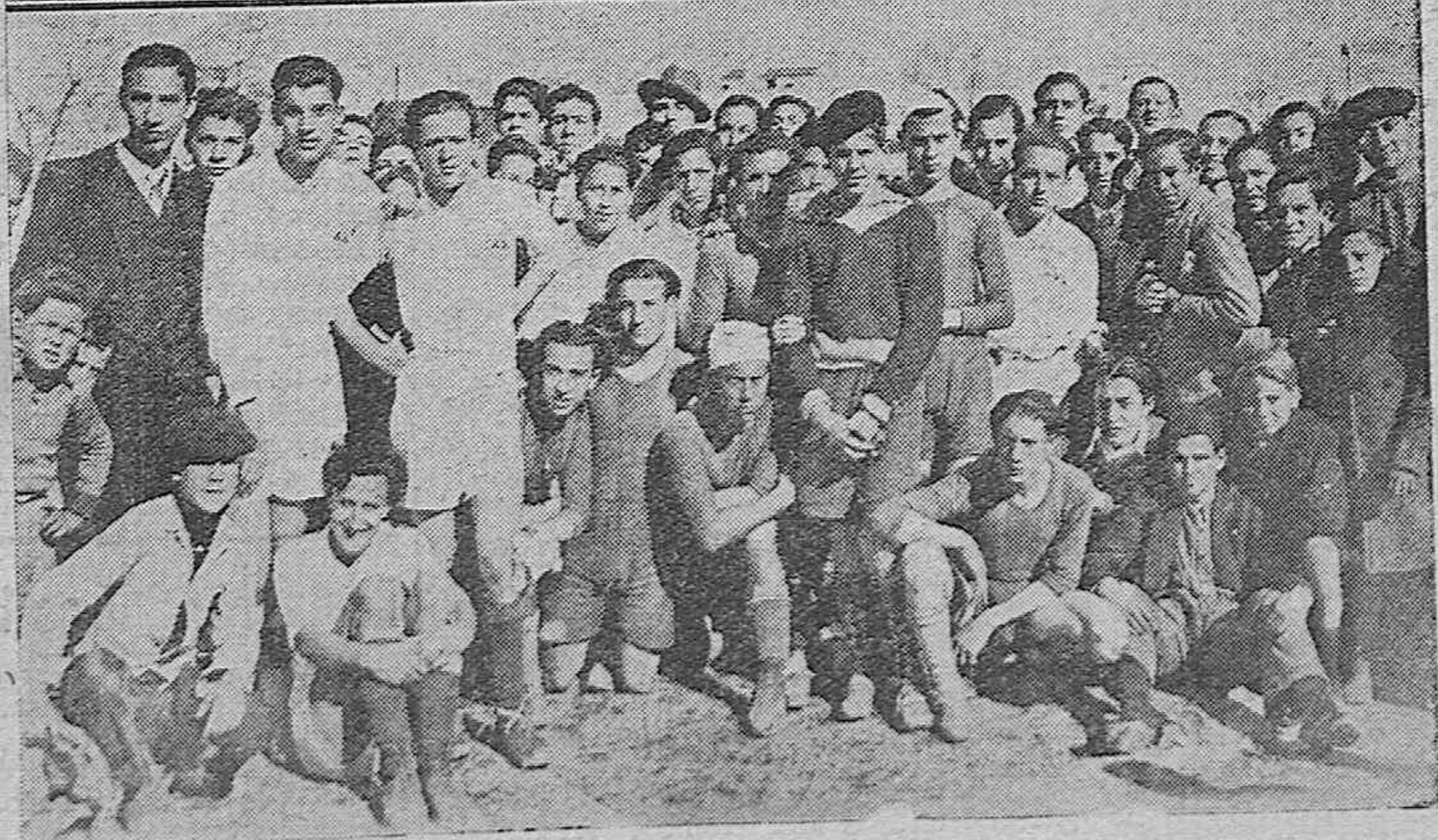
Arriba: El Colegio Oficial de Matronas celebró su asamblea anual, reuniéndose luego las asambleistas en un banquete.—Abajo: Equipo de la Federación de estudiantes católicos, que venció a la selección del Instituto en el Stadium América.