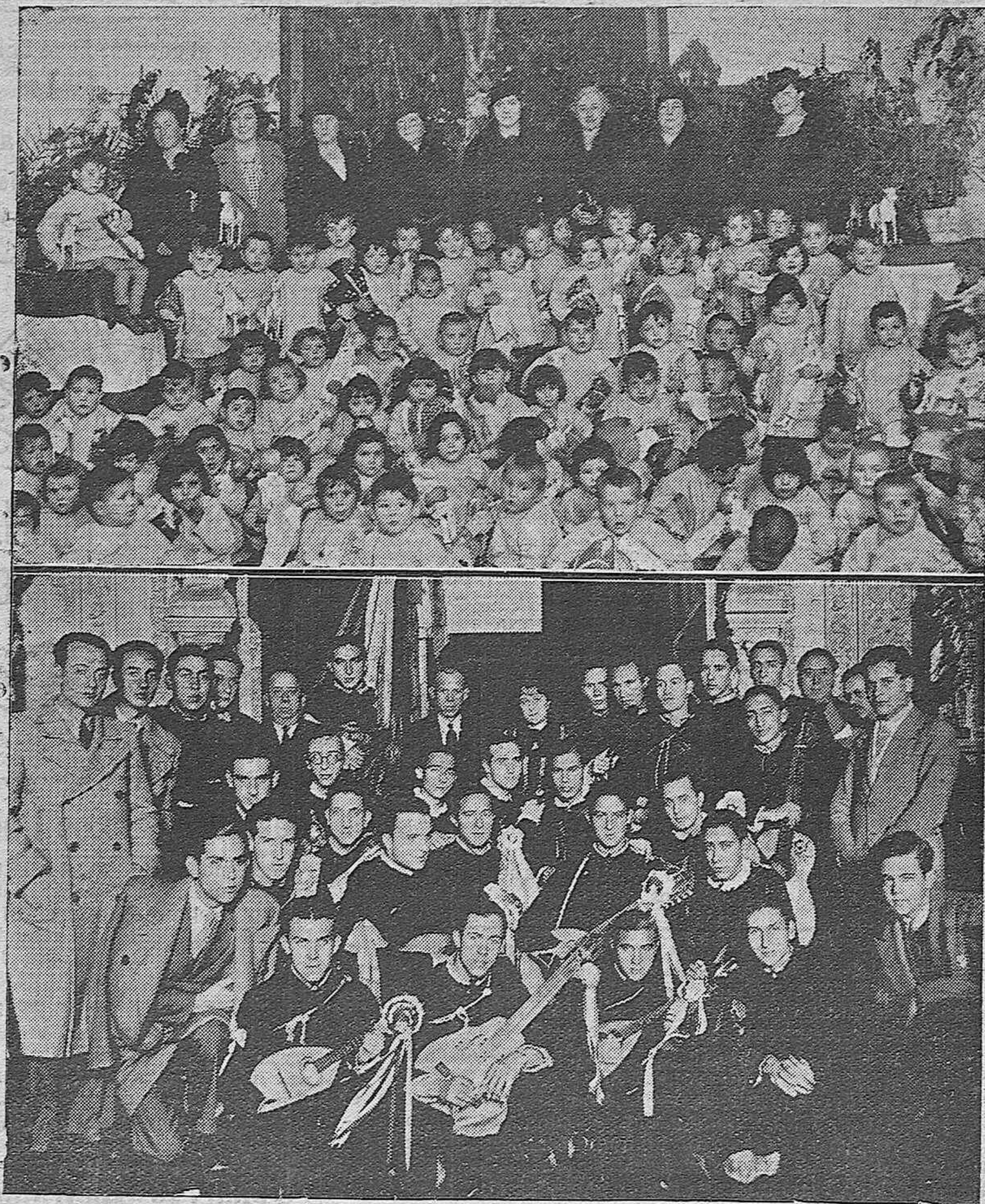
Reparto de juguetes en la Casa del Niño.—La Tuna Salmantina, durante su visita al Ayuntamiento.