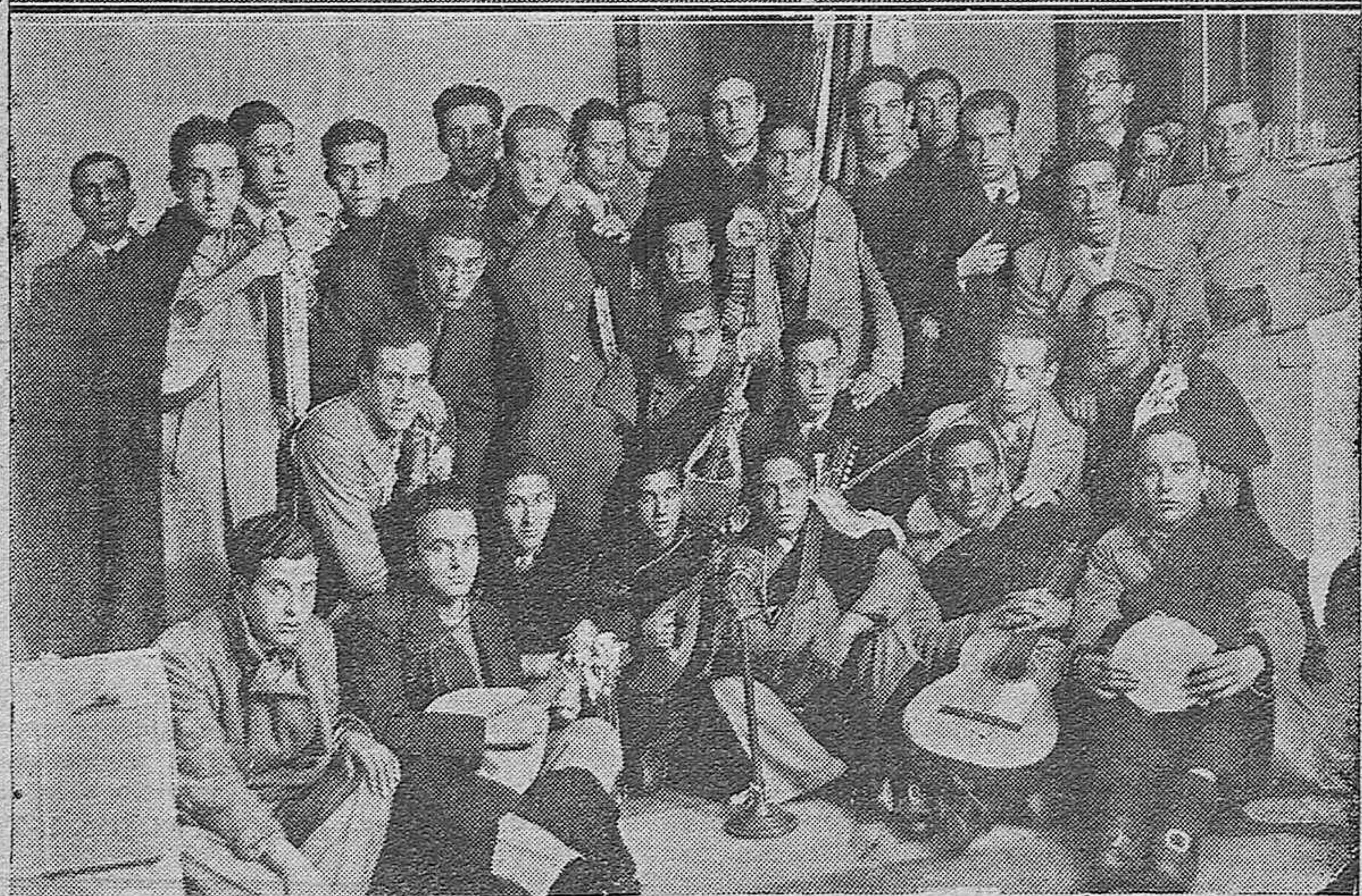
En el Salón de actos del Ayuntamiento se celebró anoche la Asamblea de Funcionarios Municipales.—Presidencia del acto.—La Tuna Escolar Salmantina de la Universidad de Salamanca durante el hermoso concierto que dió anoche ante el micrófono de nuestra Emisora E. A. J. 24 con motivo de su estancia en esta capital.