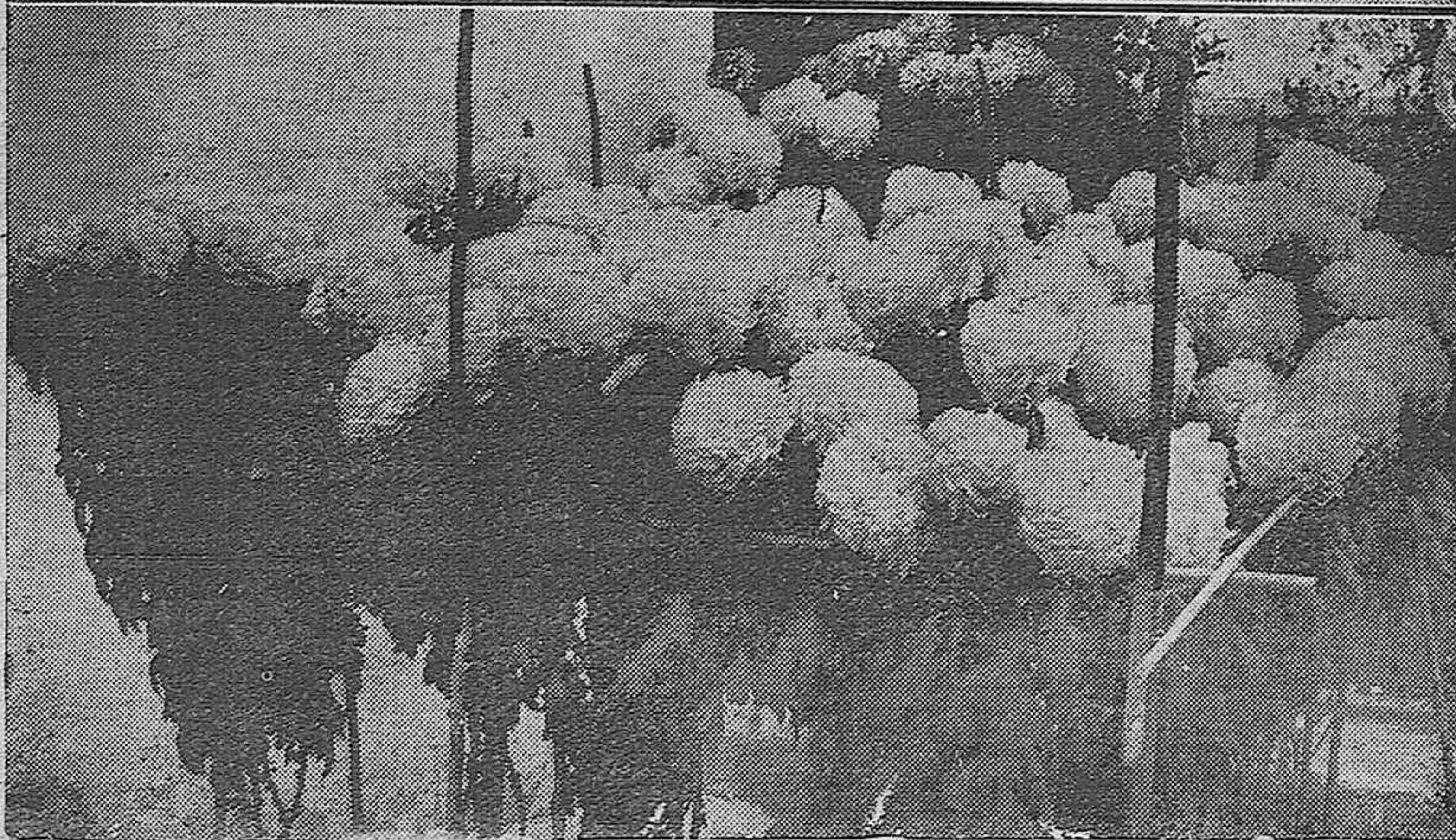
Niñas pertenecientes al Colegio gratuito de la Plaza de San Agustín.—Abajo: Plantación de magníficos crisantemos propios para ser presentados en alguna Exposición en un huerto de la calle Diego Méndez, número 10.