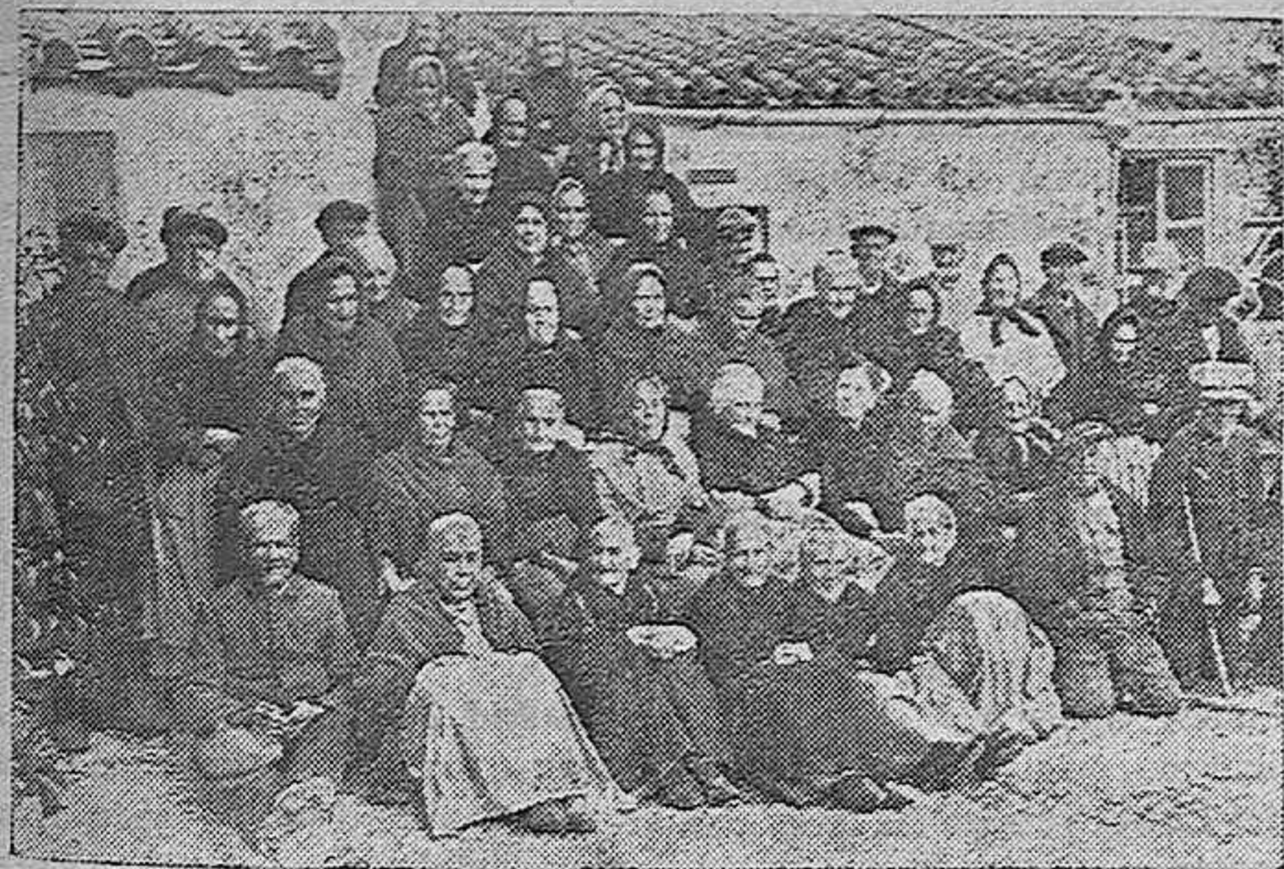
Ancianas y ancianos que fueron obsequiados por el Ayuntamiento con una comida extraordinaria para celebrar la promesa del Presidente de la República española.