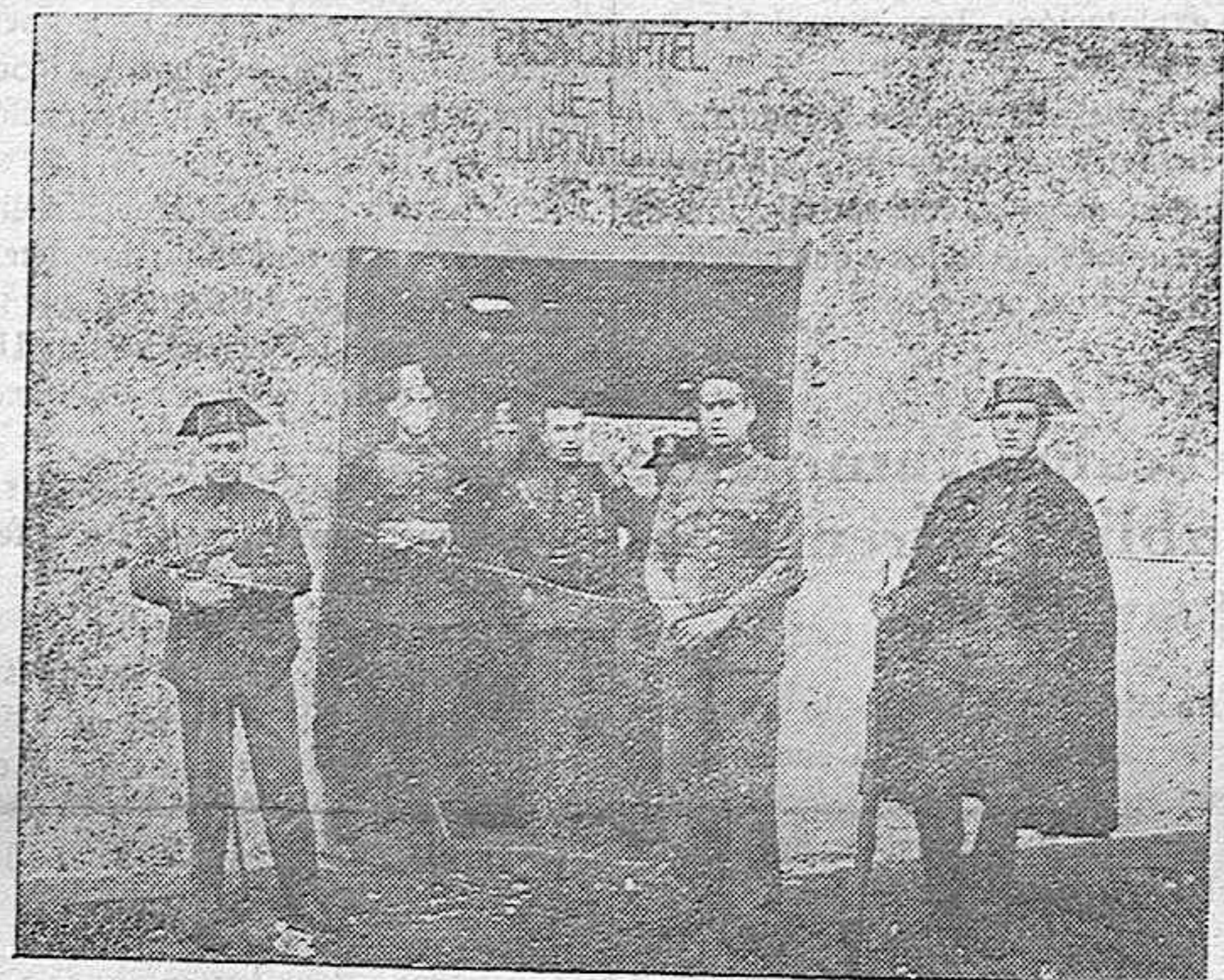
El cuartel de la Guardia civil, que se intentó asaltar por los revoltosos durante los últimos sucesos