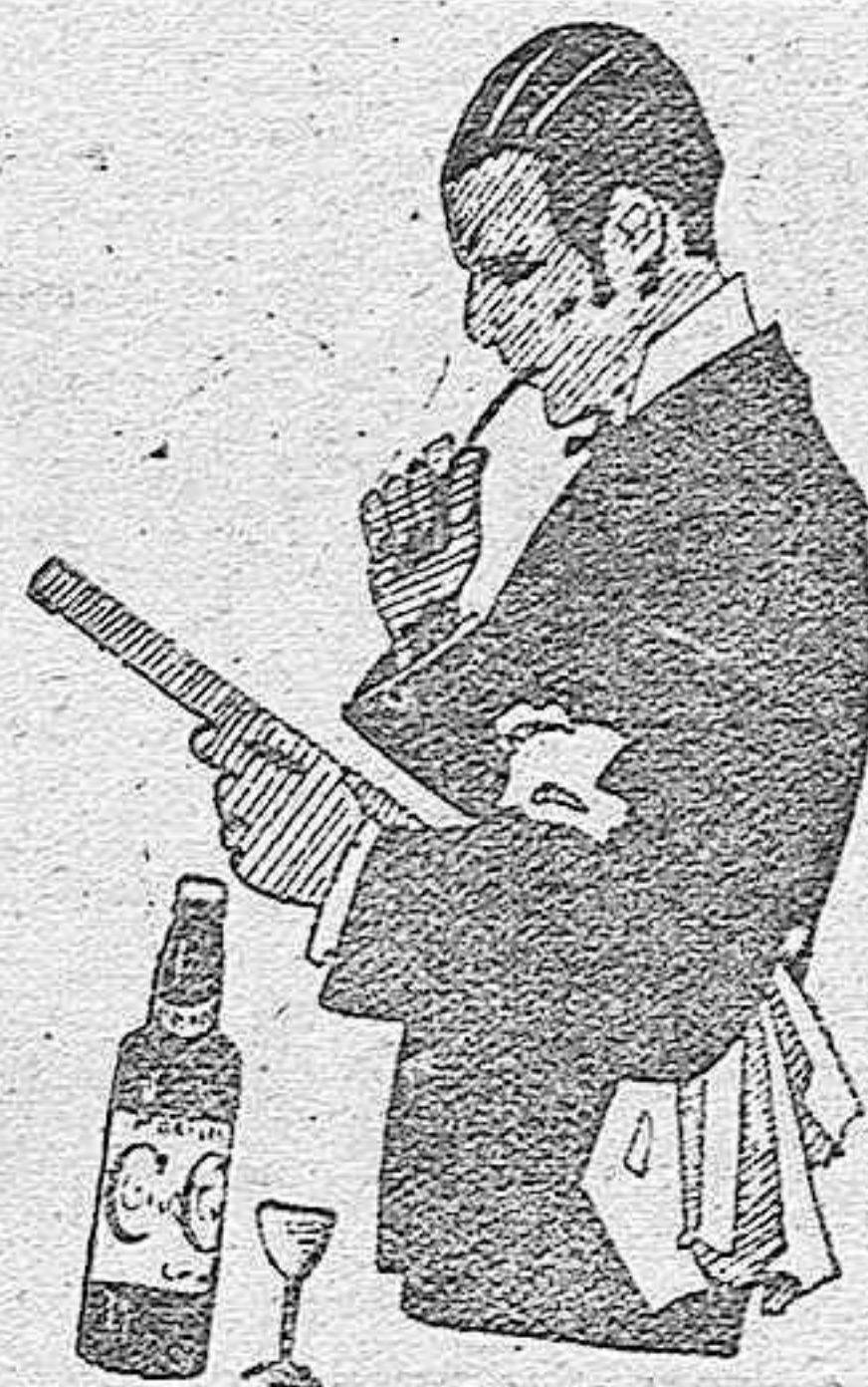
MONTILLA, siempre Cuz Conde

Tras de once meses de encierro, viene al frente: A las 37 horas sin comer ¡pobre manada miliciana! le ha sabido a gloria el rico café que le ofrecemos.